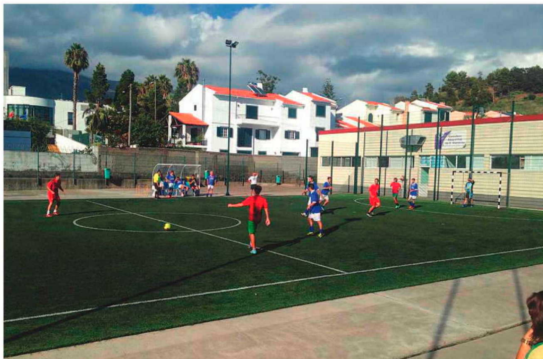
Serão 17 modalidades que serão disputadas simultaneamente em São Martinho.

A parte da tarde será preenchida com uma demonstração de hóquei em patins e patinagem artística no Pavilhão dos Barreiros, a partir das 13h30. Os torneios de futebol feminino na Arca da Ajuda, RG3 e de voleibol, nos Jardins da Ajuda, iniciam-se às 14 horas. No final do dia haverá uma demonstração de karaté na Junta de Freguesia.