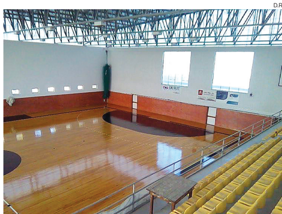
O remodelado pavilhão já apresenta melhores condições

A equipa sénior da Artística de Avanca regressa, hoje, a “casa”, após a remodelação do Pavilhão Adelino Dias Costa, onde joga, a partir das 18 horas, frente ao AC Fafe, em jogo a contar para a quinta jornada do Campeonato da Divisão A1 de Andebol. Será o primeiro encontro diante dos seus adeptos e simpatizantes há muito esperado, depois da intervenção a que foi sujeito o pavilhão, com a renovação de toda a cobertura e do piso, mas também a