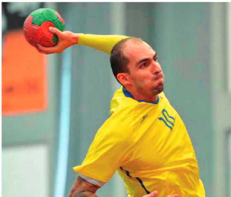
Madeira SAD foi muito superior ao Sporting da Horta