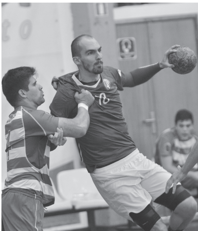
Madeira SAD revelou grande eficácia na receção ao Sporting da Horta.

O Madeira SAD continuou a dominar o encontro num segundo período mais equilibrado