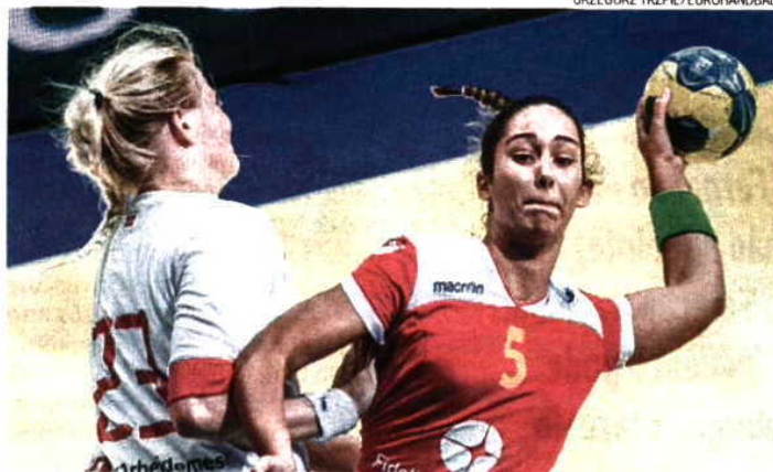
GRZEGORZ TRZPIŁ / EUROHANDBALL

Assim sendo, se a final será entre as russas e a Suécia (que venceu a Dinamarca, 30-28), Portugal ainda mantém aspirações de terminar este Europeu da Polónia com uma medalha, tendo para isso de ganhar às dinamarquesas no encontro do 3.º/4.º classificados agendado para amanhã, às 14 horas em Portugal continental, na cidade de Gdýnia. Ambas as seleções defrontaram-se na fase principal, quando estavam já apuradas, com vitória clara das nórdicas por 38-21. HUGO COSTA