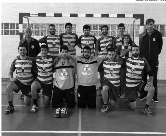
Sporting da Horta B sagrou-se campeão dos Açores de andebol