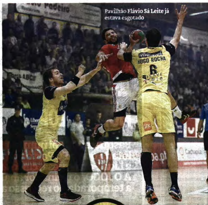
Pavilhão Flávio Sá Leite já estava esgotado

JOGO QUE DECIDE O CAMPEÃO FOI MARCADO PARA SÁBADO, ÀS 18H30, NO PAVILHÃO FLÁVIO SÁ LEITE, EM BRAGA