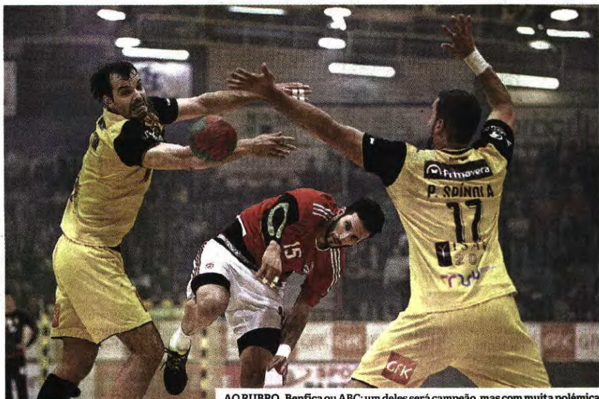
AO RUBRO. Benfica ou ABC: um deles será campeão, mas com muita polémica

"A Federação remeteu duas notificações escritas ao ABC, onde, no essencial, reiterou a necessidade de cumprimento por parte do clube das obrigações regulamentares de cedência de número de bilhetes ao adversário", sublinhou a FAP em comunicado, explicando depois que "o ABC não cumpriu nem fez prova de cumpri-