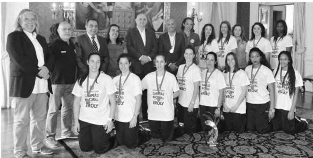
Madeira Andebol SAD feminina foi recebida ontem nos paços do Concelho.