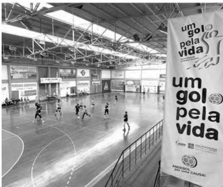
Os madeirenses vão voltar a marcar ‘Um Golo pela Vida’.

As inscrições, que são limitadas e serão seleccionadas por ordem de chegada, têm um custo de 50 euros