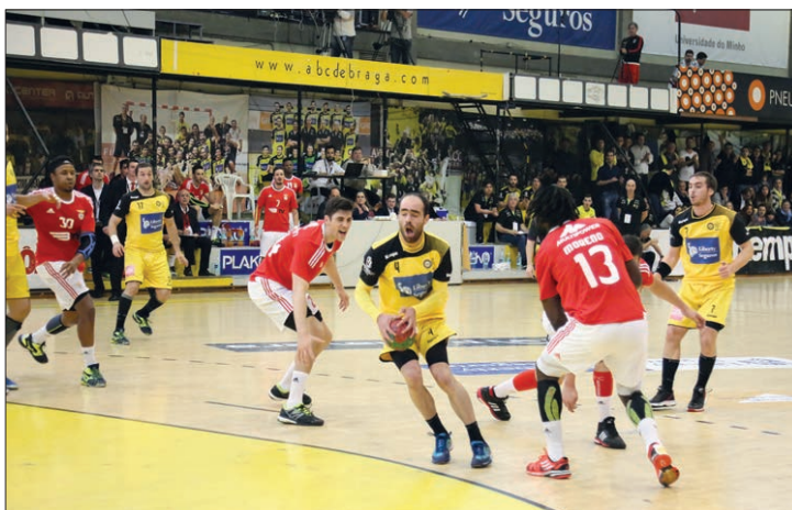
Reencontro ABC-Benfica fica adiado... talvez para sábado

A "bomba" surgiu perto das 19h15, altura em que o "Benfica Stuff", twitter do Benfica, anunciou o adiamento: «O jogo com o ABC foi adiado para sábado, uma vez que o Benfica se recusou a ceder bilhetes. O ABC tem até quinta-feira para ceder bilhetes ao Ben-