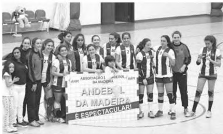
Iniciadas fecharam a fase de apuramento só com vitórias.

As fases finais ainda não têm dada marcada pela Federação de Andebol de Portugal, mas para além de tudo este foi um fim-de-semana em grande para o CS Madeira que agora também na formação consegue mais duas equipas na fase final. H. D. P.