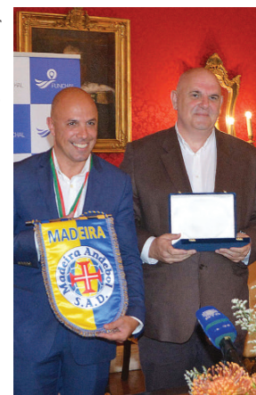
Clube e Autarquia trocaram prendas.