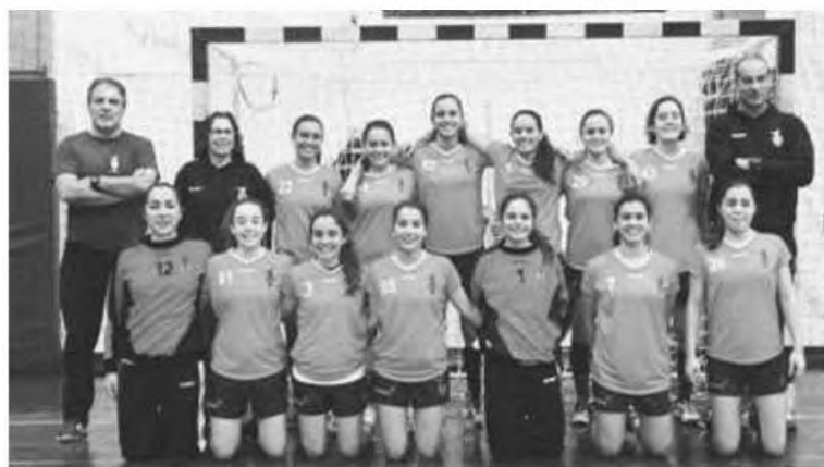
Equipa de juniores irá lutar pelo título nacional.