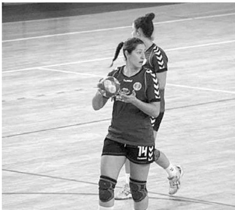
SAD deu espectáculo frente a outro candidato ao título.

Uma segunda parte de grande nível com as andebolistas madei-