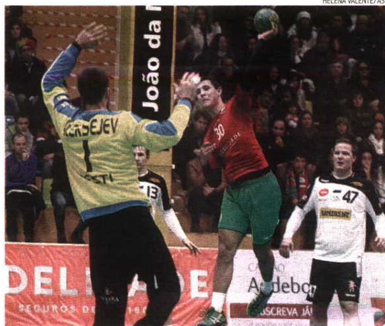
Um público entusiasta correu ao pavilhão das Travessas para assistir ao sucesso garantido desde cedo por Portugal

Perante os resultados de ontem, e quando faltam duas rondas para o fim da fase de grupos, a Seleção Nacional está obrigada a vencer na Letónia, na próxima quarta-feira,