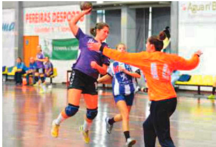
Madeira SAD e Sports Madeira voltam hoje à competição.