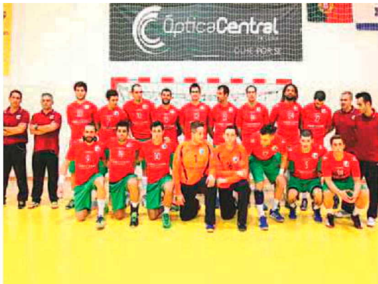
Portugal conta com dois jogadores madeirenses na luta pelo Mundial.