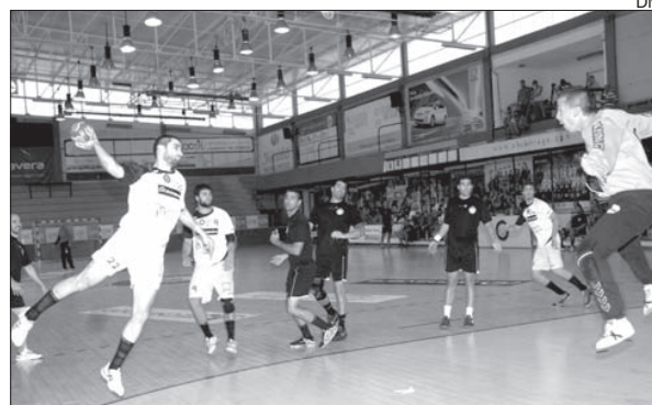
Campeonato português alvo de mudanças

De acordo com o organismo, Portugal vai ter apenas uma equipa a par-