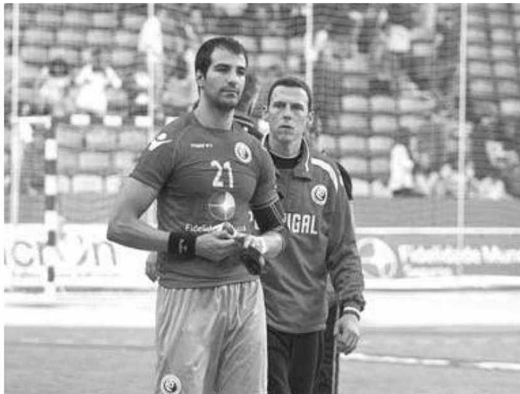
Seleção de andebol continua a sonhar com o apuramento ao Mundial.