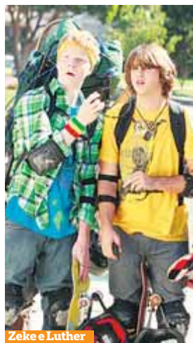
Zeke e Luther

Maratona de sete episódios da série Avô Minúsculo . Conta a história de um avô muito especial que tem um chapéu com o poder de o reduzir até ficar mínimo.