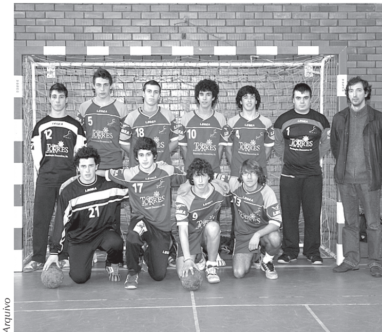
Juvenis venceram campeonato regional em 2009, mas só agora vão receber o troféu

No intervalo do jogo será finalmente entregue, já tardiamente, o troféu de Campeões Regionais de Juvenis, época 2008/2009.