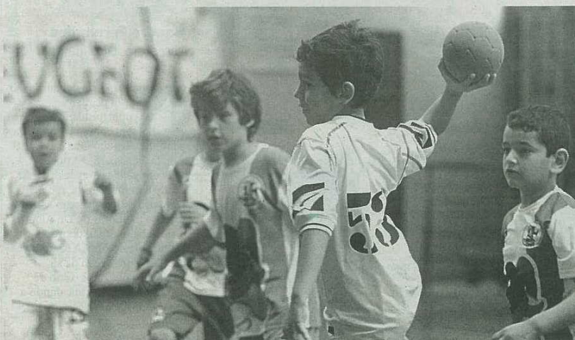
Minis começaram o ano com o pontapé de saída da II Taça da época.

O passado fim-de-semana ficou marcado pelo regresso da festa do andebol regional e com o destaque a ir para o escalão mais baixo, os Minis, que tiveram direito ao pontapé de saída da segunda Taça da época. O Pavilhão do Funchal foi o palco onde a 'pequenada' quis mostrar os seus dotes de 'craques' com a equipa masculina da Bartolomeu Perestrelo e a formação feminina do Club Sports Madeira a serem as mais felizes no que concerne aos resultados finais, nestas primeiras jornadas.