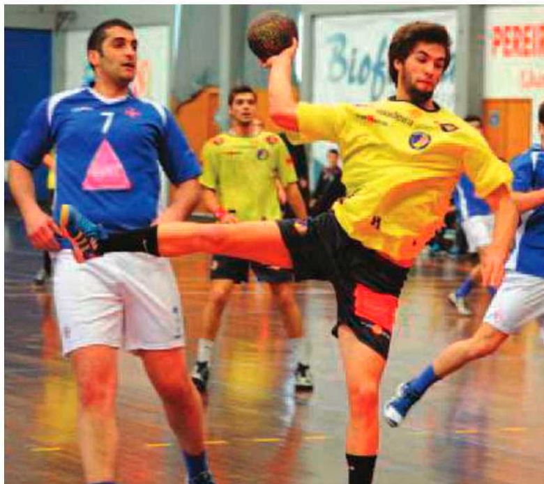
SAD continua a não traçar um plano que assegure o futuro.

O tema, ao que parece, já foi debatido em diversas ocasiões, embora da reunião magna mantida ontem, entre todos os elementos que representam os accionistas da SAD, a única informação que transpirou para o domínio público tenha sido a recon-