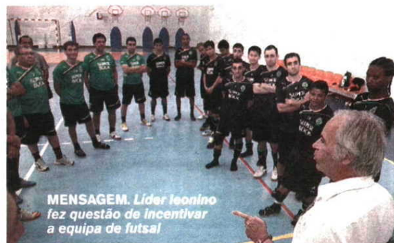
MENSAGEM. Líder leonino fez questão de incentivar a equipa de futsal

grupo de trabalho, sobretudo pela união demonstrada na final do play-off quando o Sporting venceu os três jogos ao Benfica. “Tive a oportunidade de ver duas partidas, uma delas na Luz, que foi inesquecível. E vocês foram um exemplo em termos coletivos”, sublinhou o dirigente, deixando votos de felicidade ao plantel: “Vamos ter uma excelente temporada. Obrigada pela época passada e boa sorte para o novo ano.” □