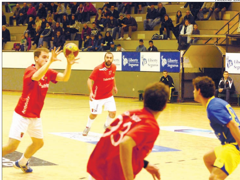
Arsenal da Devesa cilindrada equipa de escalão superior

A carreira de tiro estava quase sempre aberta –