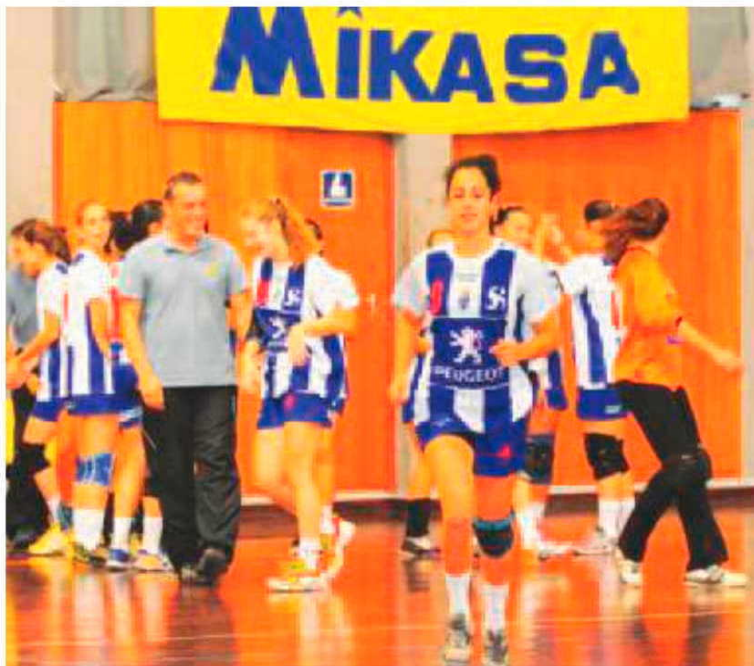
Sports Madeira recebe hoje a visita do Juventude de Lis.

Duas horas mais tarde, às 19 horas, ainda naquele recinto, será a vez do Sports da Madeira medir forças com o Juventude de Lis, ad-