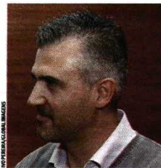
INFORMAÇÃO CULTURAL IMAGENS

nacional masculino pelo FC Porto, está presente na fase final da maior competição do andebol feminino, pois estreou-se ao comando de outra seleção africana, Angola. Ontem, no jogo de abertura, a Sérvia sentiu grande dificuldade para derrotar o Japão. GANHOU por 28-26, depois de estar a perder por 10-13 ao intervalo. A.F.