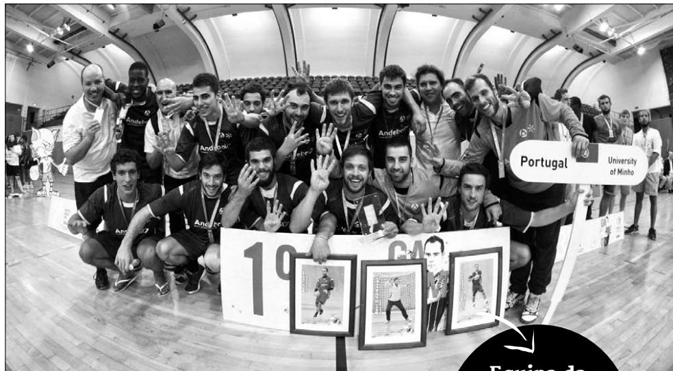
Minhotos voltaram a fazer a festa de campeões da Europa

Equipa da Universidade do Minho conquistou o 4.º título europeu