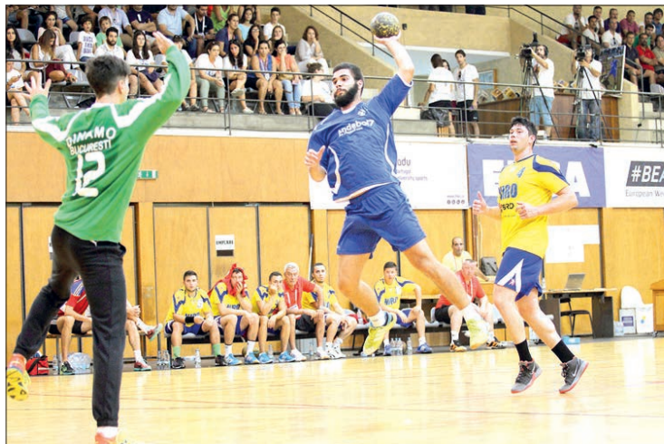
UMinho joga hoje cartada decisiva

A seleção masculina de andebol da UM discute hoje a passagem à finalíssima depois de ontem ter vencido os romenos de Pitesti, por 19-38.