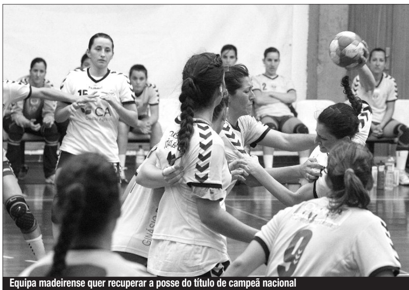
Equipa madeirense quer recuperar a posse do título de campeã nacional