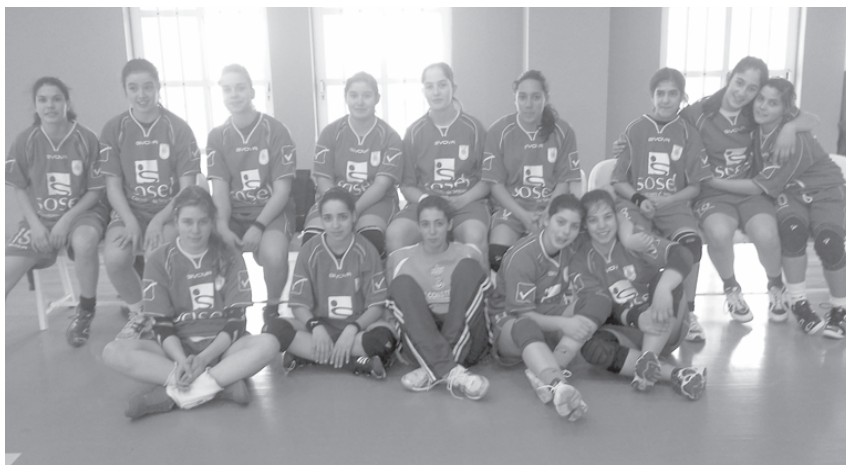
As Juvenis brilharam na primeira fase do Campeonato. Agora vão disputar a ronda com as 12 melhores equipas nacionais.

Este é o primeiro ano que o ACOF tem em funcionamento o escalão das Iniciadas, destinado a jovens entre os