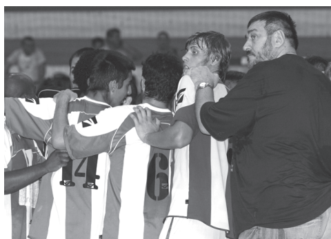
MISSÃO – Vitória venceu jogo em atraso e ganha espaço para apuramento

CALENDÁRIO: Fiquemos com o calendário das equipas que estão na luta pelo apuramento: 17.ª jornada, 12 de Fevereiro: Vitória-CDE Camões (18.00 horas, Pavilhão Antoine Velge); AC Sismaria-Ginásio do Sul e Marítimo-Passos Manuel. 18.ª jornada (19 de Fevereiro): Vitória-Passos Manuel (18.30 horas, Pavilhão Antoine Velge, houve troca de ordem na primei-