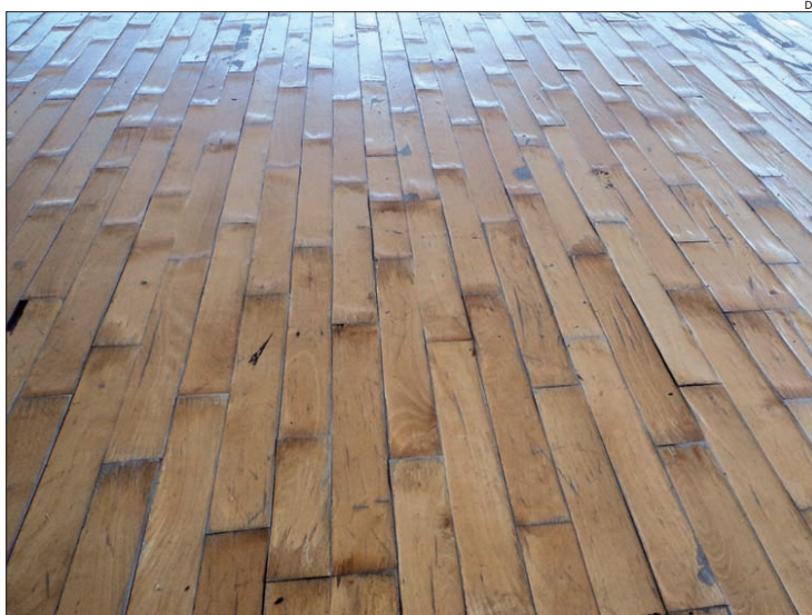
Piso do Pavilhão Flávio Sá Leite ficou neste estado

Sem espaço e condições para receber jogos após a intempérie, o ABC solicitou de imediato à Federação de Andebol de Portugal para receber