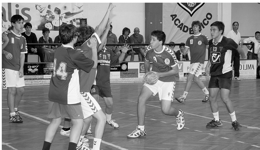
Prova de iniciados juntou Feirense, S. Bernardo e Infesta na tarde de ontem

Seguiu-se o S.Bernardo com o CD Feirense. O anfitrião estreava-se no torneio e começou cedo a dar mostras de que queria vencer a contenda. Tal veio a acontecer