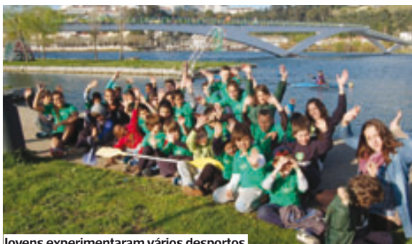
Jovens experimentaram vários desportos

A vertente desportiva também não foi esquecida e para além do râguebi, ténis, natação, andebol, futebol, remo e canoagem foram outros desportos que ficaram a conhecer com