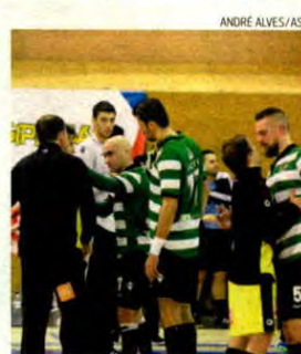
Instalou-se a confusão na partida