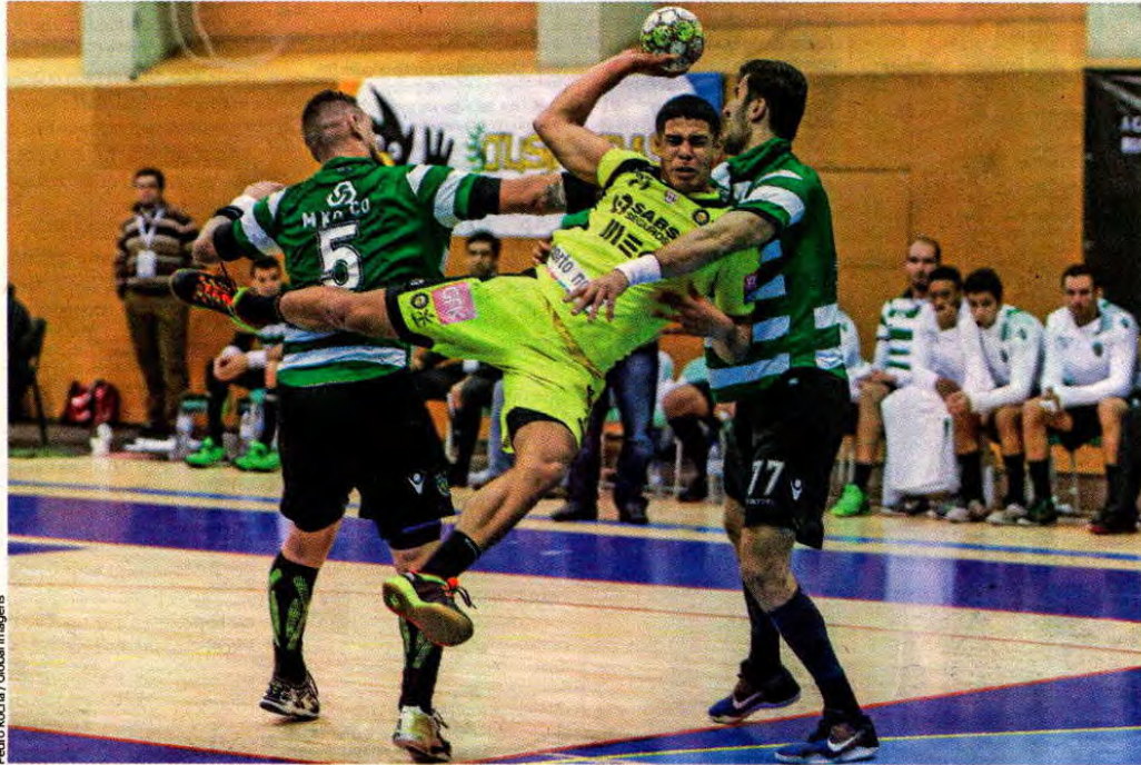
Pedro Rocha / Global Imagens