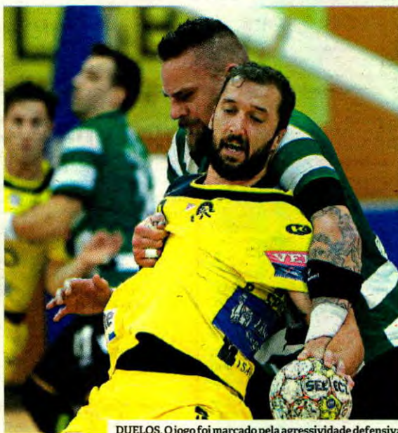
DUELOS. O jogo foi marcado pela agressividade defensiva

Num duelo equilibrado, a intensidade e (muita) agressividade defensiva do ABC acabou por fazer a diferença diante do melhor ataque do campeonato, que registou um recorde negativo de golos em 2016/17, não tendo conseguido sequer chegar aos 25 tentos pela primeira vez esta temporada.