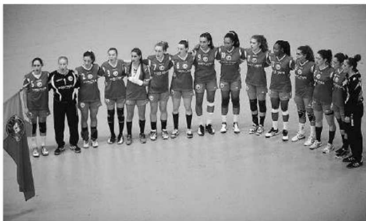
Seleção venceu o Japão, com cinco madeirenses em jogo.