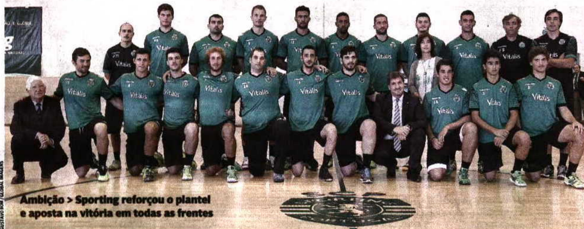
Ambição > Sporting reforçou o plantel e aposta na vitória em todas as frentes