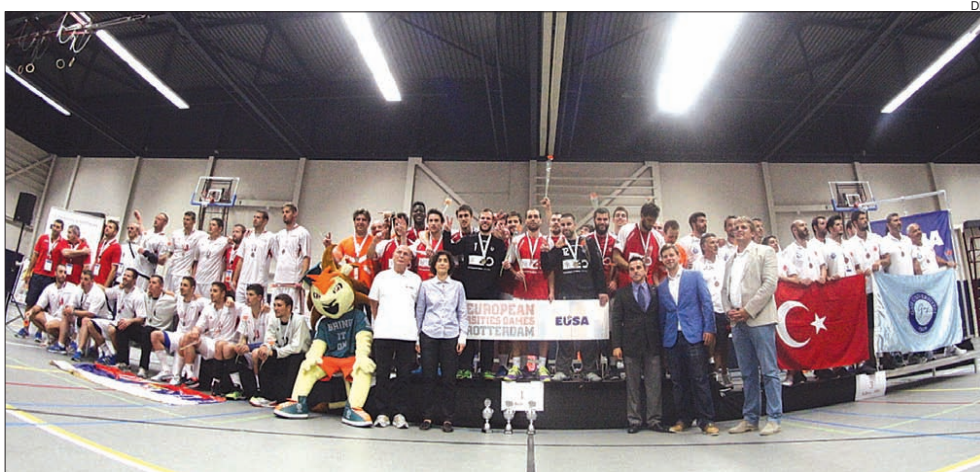
Equipa da Universidade do Minho no pódio

A UMinho sagrou-se, ontem, pela segunda vez consecutiva campeã europeia universitária de andebol ao vencer por 25-20 a sua congénere sérvia de Novi Sad. Este é o terceiro título europeu do andebol da UMinho e a sétima final disputada.