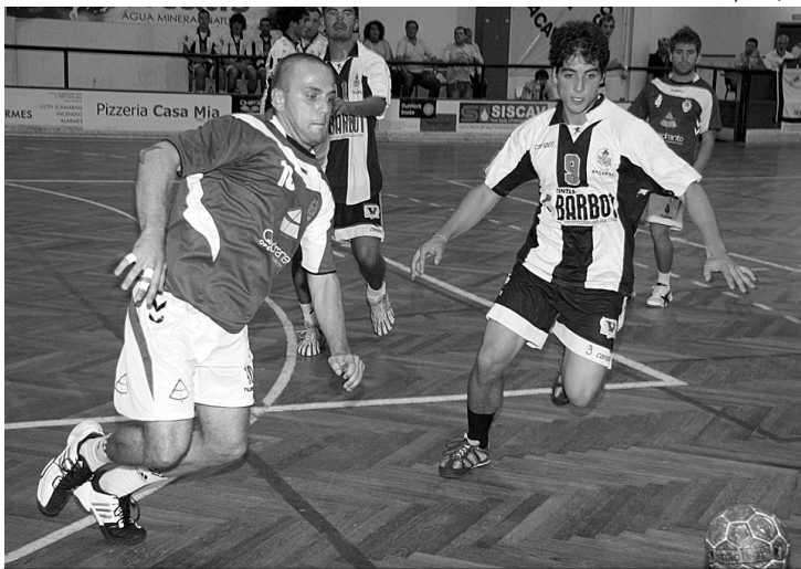
Feirense não conseguiu ultrapassar o Arsenal de Canelas