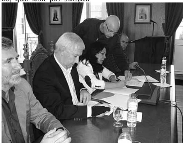
Município e Federação assinam protocolo de colaboração

O protocolo assinado tem como principal objectivo a realização de um “Plano de Desenvolvimento do Andebol no Concelho de Fornos de Algodres” e as duas entidades comprometem-se a cooperar para a realização de um conjunto de acções que possibilitem a promoção e prática do andebol à população jovem do concelho de Fornos de Algodres.