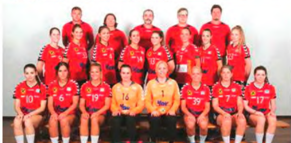
Brest defronta Madeira SAD e SSV Dornbirn Schoren o CS Madeira.