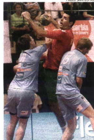
Portugal reencontra a Eslovénia em junho