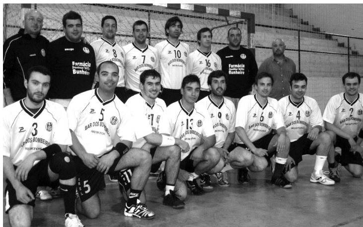
EQUIPA SÉNIOR do Monte dá ao técnico garantias de poder subir de divisão

A campanha da equipa da Murtosa arrancou, no passado fim-de-semana, depois do sorteio ter ditado que o primeiro jogo, diante da forte formação do Samora Correia, fosse perante o