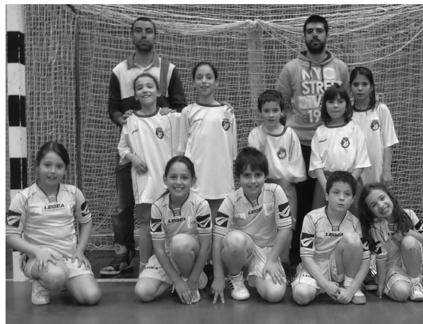
BAMBIS VOUZELENSES participaram no Festand de Nelas

Decorreu no passado domingo no Pavilhão Municipal de Nelas, o 5.º Festand de bambis da Associação de Andebol de Viseu. O evento contou com a presença das equipas de S. Miguel do Mato, Santiago de Besteiros e a equipa anfitriã, o ABC de Nelas. Foi uma tarde com muitos jogos