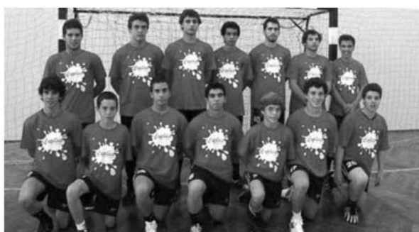
Juvenis da B. Perestrelo sagram-se campeões na última jornada.