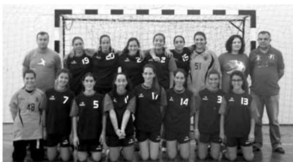
... juntamente com a equipa feminina.