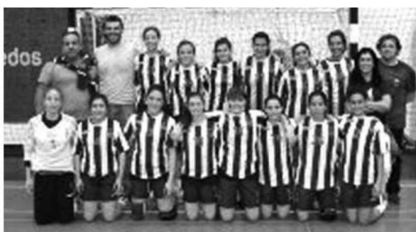
CS Madeira foi mais forte nos juvenis femininos, na recta final.