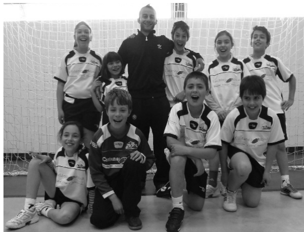
MINIS DE VOUZELA mostraram evolução em Resende

■ No passado sábado a equipa de minis da Escolinha de Andebol da Associação S. Miguel do Mato deslocou-se a Anreade (Resende), para disputar com a equipa da casa, a 1.ª Concentração da 3.ª Fase do Campeonato Regional da Associação de Andebol de Viseu.