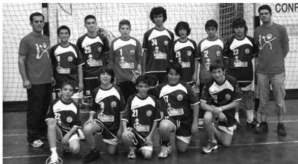
Equipa do Infante que se sagrou campeão da Madeira de infantis masculinos.