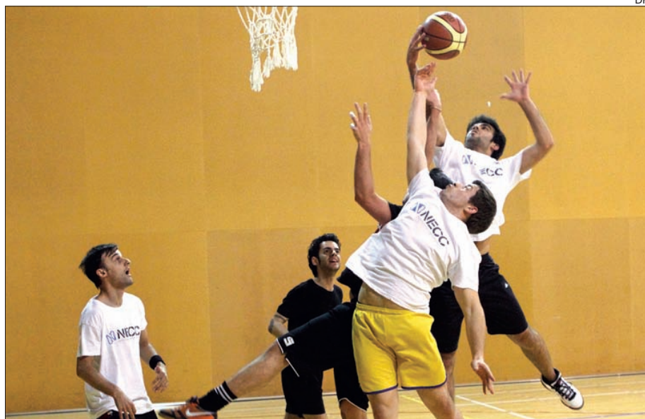
Um pormenor de um encontro de basquetebol masculino

A fase de grupos do Troféu Reitor em basquetebol encerrou ontem com a realização de quatro jogos, e apurou as oito para os quartos de final: LCC, MIEEIC, LEI, Eng. a Biológica, Economia, Direito, Eng. Biomédica e AFUM.