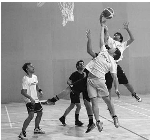
Já são conhecidas as equipas que disputam os 'oitavos' no basquetebol