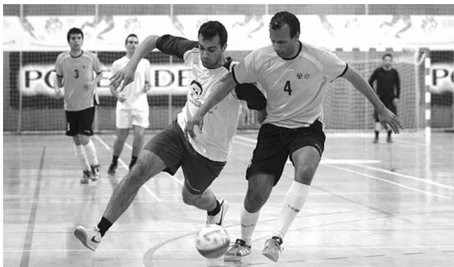
Equipa de antigos alunos conquistou a goleada dos oitavos-de-final, ao bater MEI por claros 10-0

Na última partida, o frente-a-frente entre Eng. a Civil e a AFUM. Os Funcionários foram uma presa fácil para uma equipa recheada de bons executantes, como confirma o resultado final de esclarecedores 33-13.