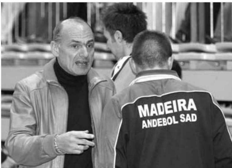
Treinador ucraniano já conquistou o título nacional pelo Madeira SAD.