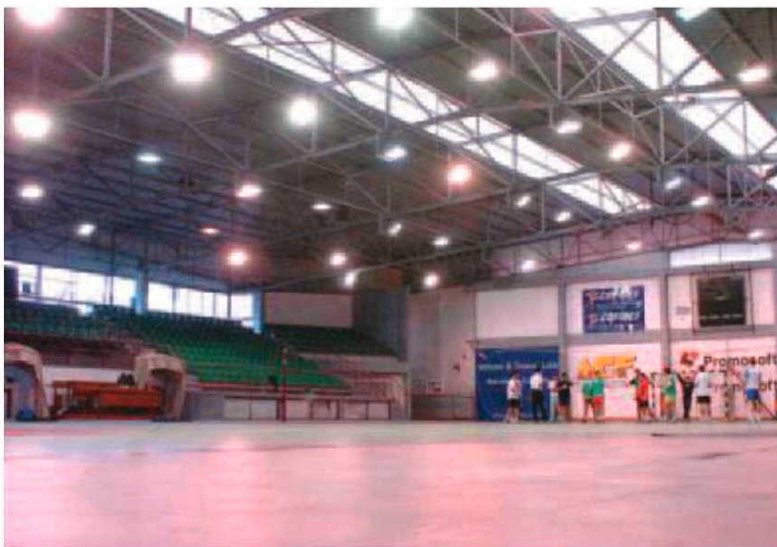
AAM lamenta a decisão 'imposta' pelo mau comportamento dos pais.

No comunicado da AAM há a justificação para o insólito, podendo ler-se: "Face aos acontecimentos verificados em alguns jogos da competição regional e como medida preventiva, a AAM informa todos os interessados que o jogo n.º 1422 referente ao Torneio de Encerramento será efectuado à porta fechada, sendo apenas permitido o acesso ao pavilhão do Funchal a elementos do departamento técnico