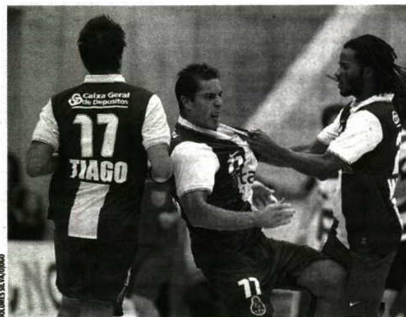
FC Porto > Regressa hoje ao Dragão com o São Bernardo

O Benfica deve ter um jogo calmo, ao receber o Marítimo.