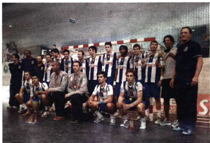
F. C. Porto em festa com a conquista do primeiro troféu na época 2011/2012