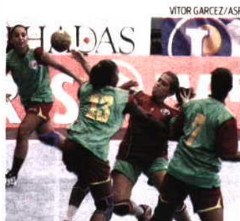
Estrelas femininas juntas pela primeira vez