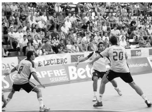
Depois de vencer o ABC, Benfica vai agora medir forças com o FC Porto