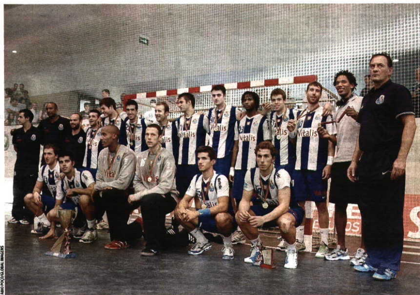
Vitória FC Porto conquistou a primeira edição do Torneio de Portugal