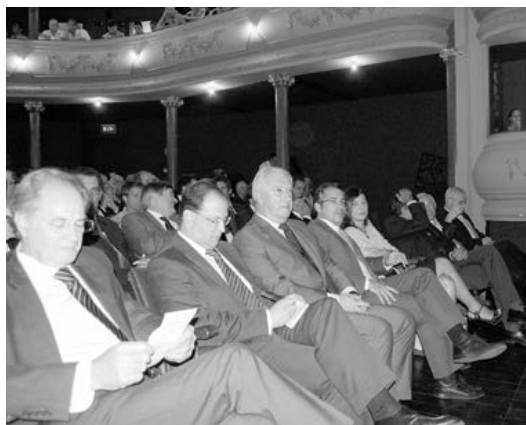
O evento reuniu cerca de 300 convidados no Cine Teatro, em Fafe