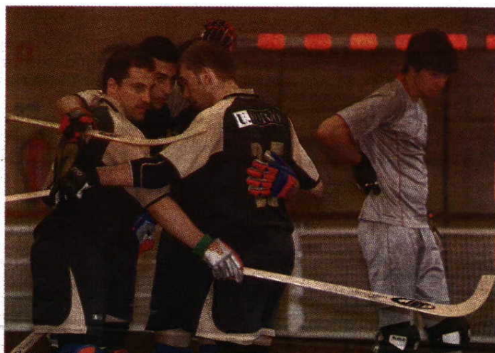
Festa > Universidade do Porto revalidou o título ao terminar com uma goleada

Apesar dessa relação "amor-ódio", é curioso o facto de grande parte dos jogadores usar material dos respectivos clubes. "O hóquei em patins é um desporto em que os jogadores criam uma afinidade muito grande com o seu equipamento. Não é fácil para um jogador trocar de patins quando está habituado a eles. É como, por exemplo, um jogador de futebol ter de trocar de chuteiras. Mas a UP coloca à disposição joalheiras, luvas, stiques, bolas e o vestuário desportivo. Fica ao critério de cada um usar ou não esse material", destacou o técnico dos bicampeões.