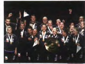
EUROPEAN CHAMPION 2016