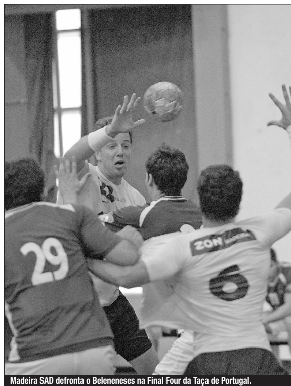
Madeira SAD defronta o Belenenses na Final Four da Taça de Portugal.

Dos dois clubes presentes no sorteio (FC Porto e Benfica), apenas o representante 'encarnado' falou à comunicação social, considerando que "teoricamente são duas das equipas mais fortes, mas a Taça é sempre Taça" e "qualquer clube pode ganhar".