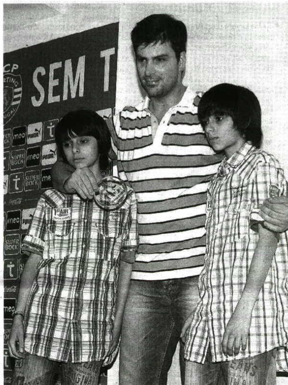
FAMÍLIA. Pivot recebeu uma recordação das mãos dos sobrinhos