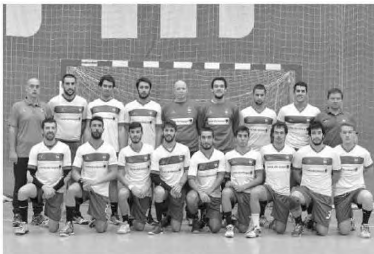
Madeirenses foram infelizes no Norte