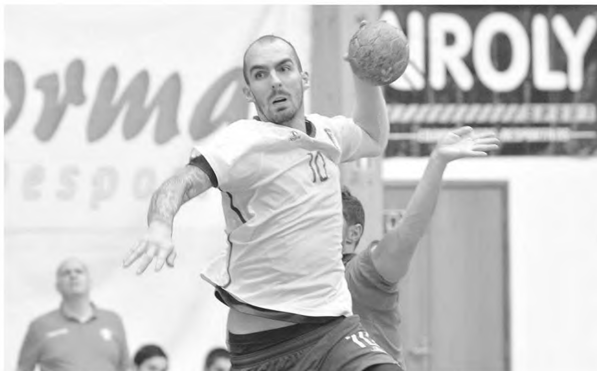
Os atletas madeirenses foram sempre superiores aos visitantes do clube Passos Manuel.