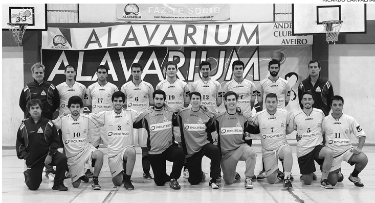
Equipa masculina do Alavarium já sabe o que é vencer na 3.ª Divisão Nacional