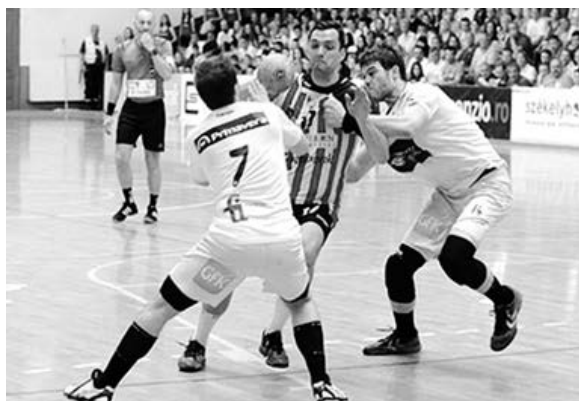
Ontem na Roménia, ABC/UMinho superou-se na segunda parte