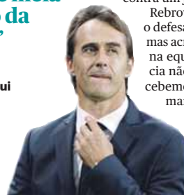
Julen Lopetegui FC Porto

partida mais importante da temporada para nós, mas se as coisas não correrem como esperamos também não será o fim do mundo.”