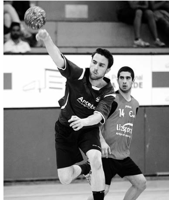
AAUMinho em destaque na jornada concentrada dos campeonatos universitários

"Quero destacar todos os atletas que se mostraram disponíveis. Não é fácil neste momento, conseguir ter os estudantes/ atletas sempre disponíveis, pois estamos num período de exames. Para dificultar ainda mais, a FADU, não teve em consideração a época desportiva federada e marcou esta jornada concentrada numa semana de competições europeias e logo a seguir a uma jornada dupla, que dificultou a convocatória. Mas, como sempre, os atletas que se disponibilizaram souberam defender e honrar as cores e pergaminhos da AAUMinho", referiu o treinador.