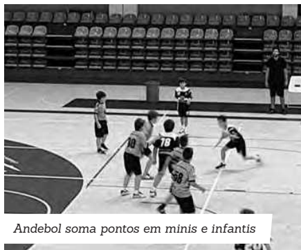
Andebol soma pontos em minis e infantis

No passado fim de semana, os minis do Clube de Andebol da Póvoa receberam e venceram a equipa do Santo Tirso, assim como os infantis que venceram o Macieira e conseguiram o primeiro lugar na primeira ronda do campeonato do escalão. "O resultado espelha a diferença entre as equipas. Os infantis terminaram assim a primeira ronda do campeonato em primeiro lugar, aguardando agora a passagem para a próxima fase", explica a direção do clube.