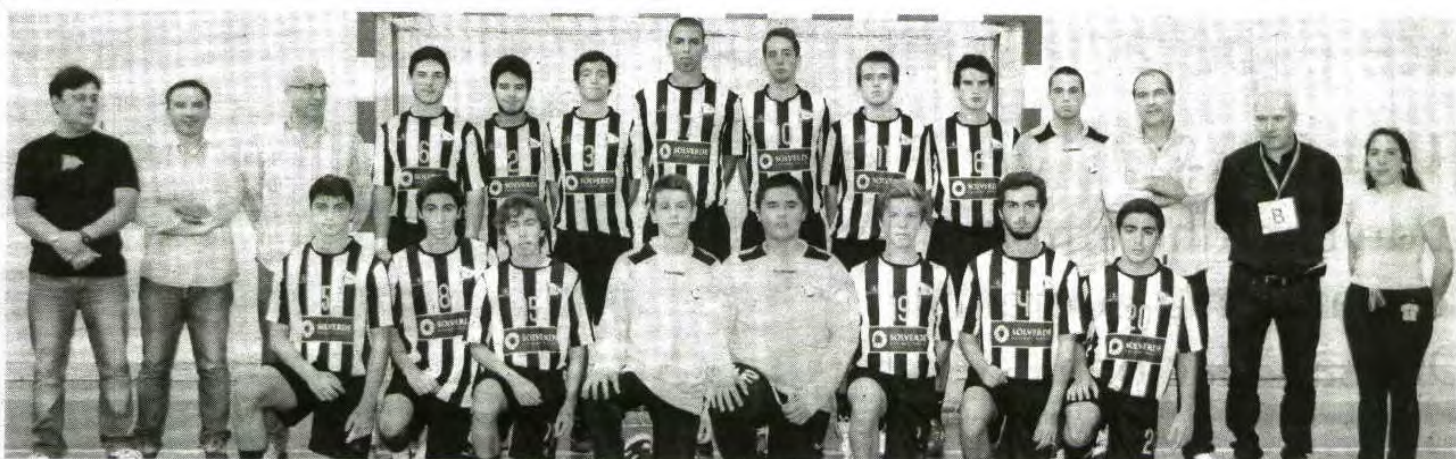
A equipa de juvenis masculinos do Sporting Clube de Espinho alcançou a terceira posição da tabela classificativa do Campeonato Nacional da 1.ª Divisão