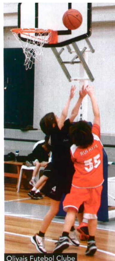
Olivais Futebol Clube

Consulte o site da Federação Portuguesa de Basquetebol em www.fpb.pt