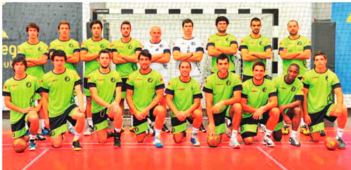
Plantel do Madeira SAD deverá sofrer uma ‘razia’.

HERBERTO DUARTE PEREIRA desporto@dnoticias.pt