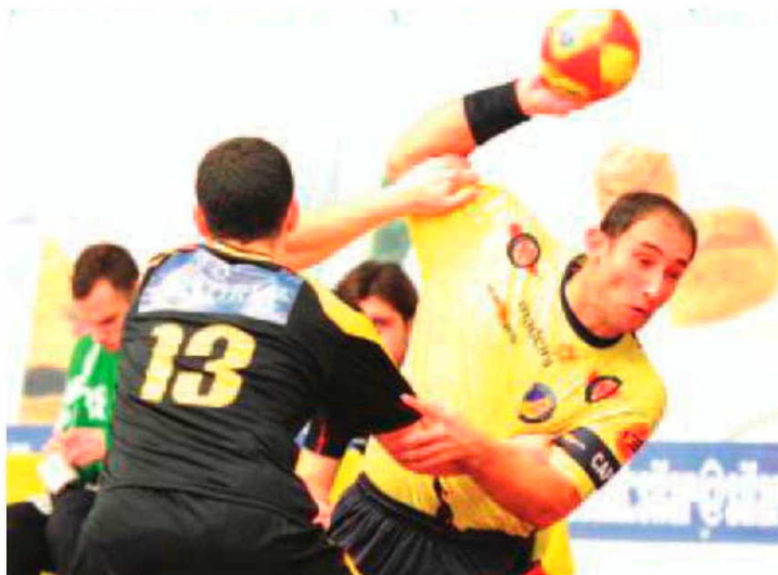
Recepção ao Avanca acontece hoje a partir das 19 horas.

No primeiro encontro do play-off de apuramento para o 7º e 8º lugares, o