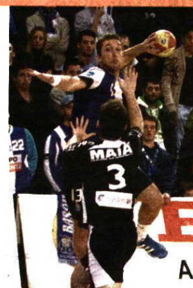
Maiatos jogam hoje no reduto azul e branco.