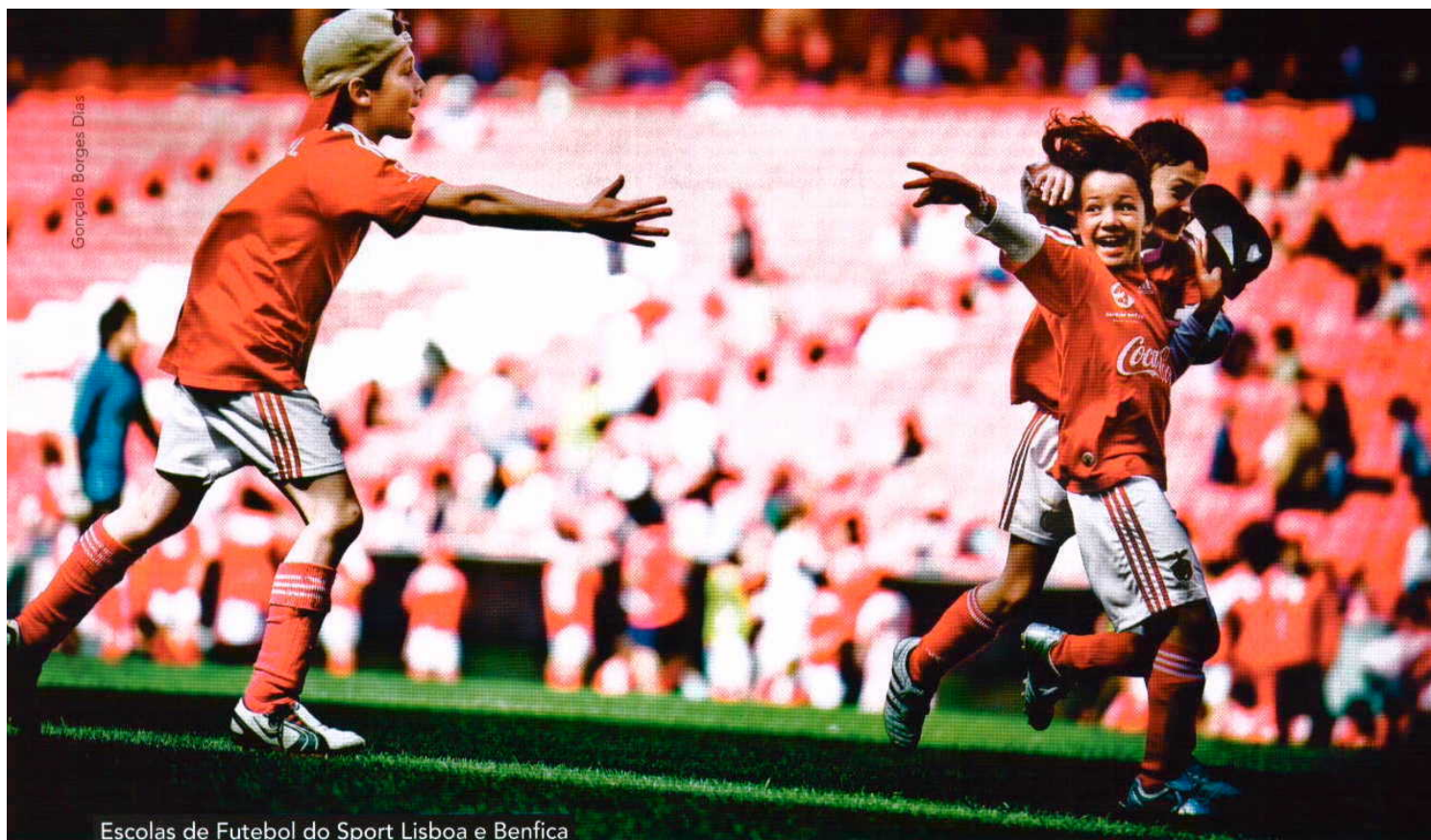
Escolas de Futebol do Sport Lisboa e Benfica

nos Seniores, mas cada coisa a seu tempo. Os treinos decorrem no estádio Nave Desportiva de Espinho, onde tudo parecerá grande para estes pequenos atletas. Tudo menos as metodologias, as regras – adaptadas às suas capacidades –, a altura da rede – que desce proporcionalmente –, o peso das bolas – aqui mais leves –, a dimensão das quadras... Enfim, é todo um universo adaptado à medida da pequenada.