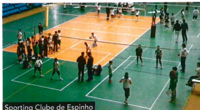
Sporting Clube de Espinho

No Sporting Clube de Espinho o voleibol não tem idade. Ou antes, tem, mas é muito abrangente. Para ingressar no escalão Minis, basta ter 5 anos e não mais do que 11. Os pais que não se preocupam, pois as classes respeitam as faixas etárias e as crianças são agrupadas dos 5 aos 9 anos – com dois treinos semanais – e dos 9 aos 11 anos – com três treinos por semana. Depois disso, bom, já são crescidos e podem avançar para os Infantis e, os verdadeiros amantes da modalidade, por ventura apenas pararão