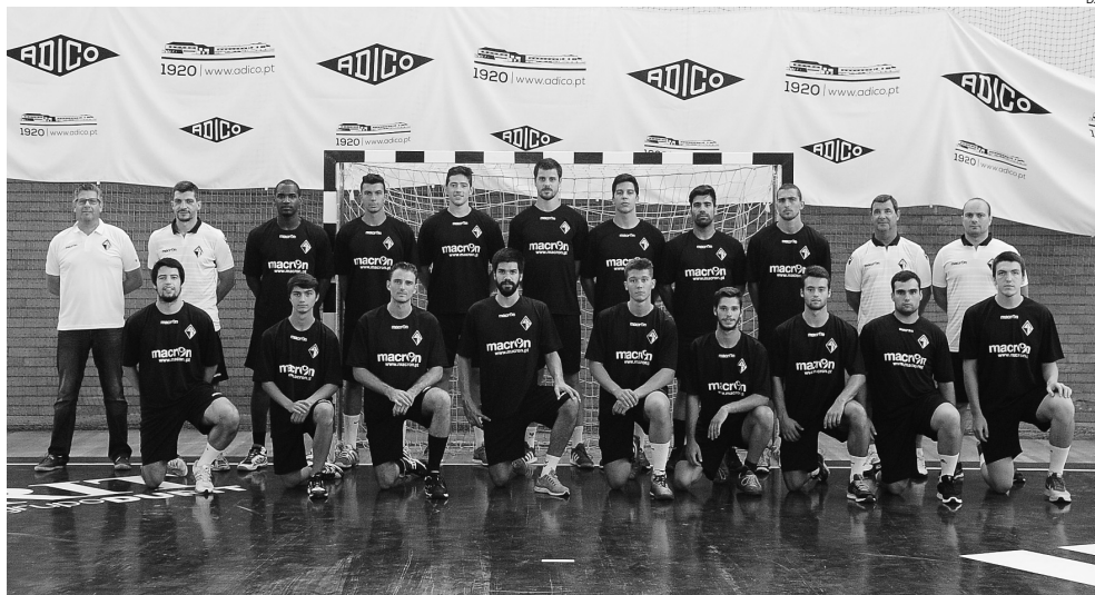
Plantel da Artística de Avanca que já começou a preparar a temporada 2016/2017

O sistema competitivo do campeonato desta época será diferente. Não haverá “play-off”