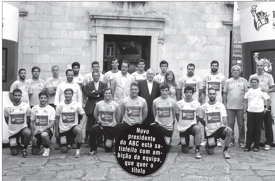
O plantel do ABC/UMinho, no Largo do Paço, para se mostrar aos bracarenses e aos vários parceiros na época 2014/15

«Não gosto da palavra prometer em desporto. Ou pelo menos prometer qualquer tipo de resultado. Aquilo que falámos no ano passado é que iríamos dar tudo para devolver Braga às competições europeias. Felizmente conseguimos. Fomos até um bocadinho mais além do que o objetivo inicial. Esta época, o nosso objetivo é bastante simples: é tentar melhorar. Sabemos que vai ser difícil. Porque melho-