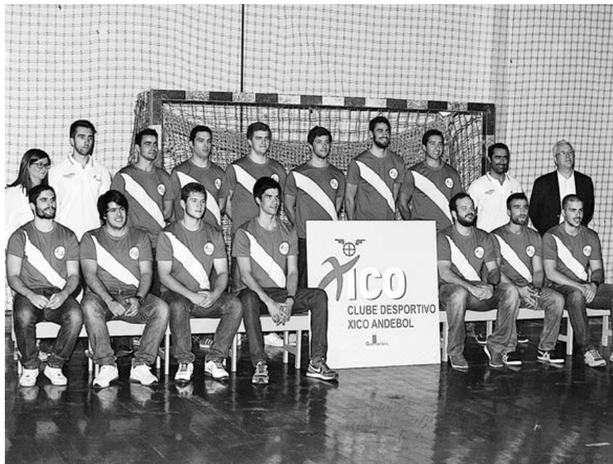
Xico Andebol enfrenta o duelo com o SL Benfica na primeira jornada do campeonato

Para o encontro do próximo sábado bem como para o restante campeonato é fundamental su-