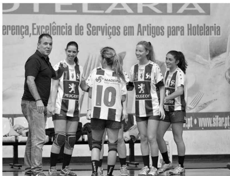
CS Madeira compete entre hoje e amanhã em Gaia.