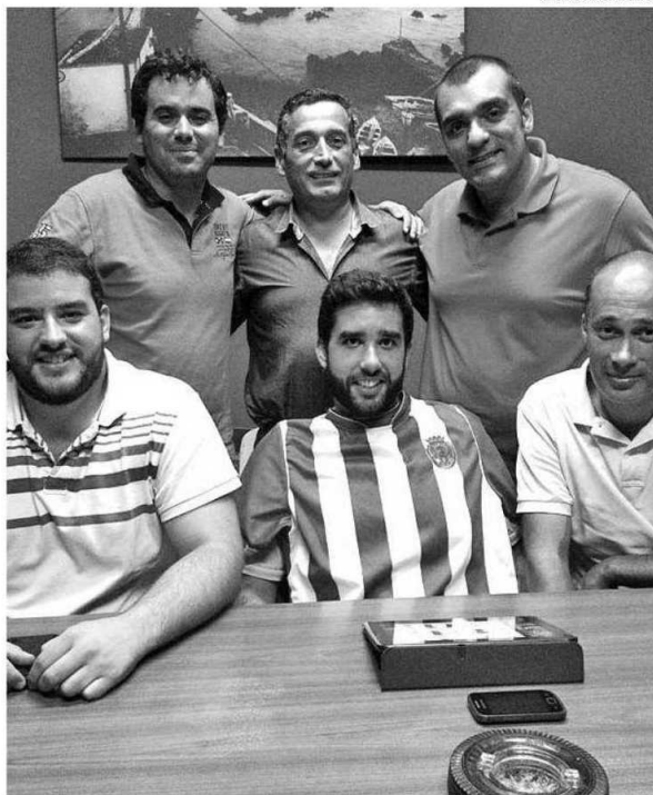
Os "azuis" da Calheta vão ter três escalões de andebol