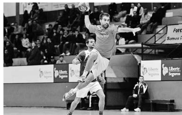
Até ao momento, a equipa bracarense venceu todos os jogos