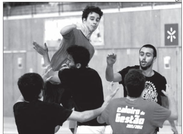
Um pormenor de um dos encontros de andebol

Psicologia e Medicina lutavam pelo segundo lugar do grupo D, sendo que no caso de Medicina a vitória colocaria a equipa com os mesmos pontos do primei-