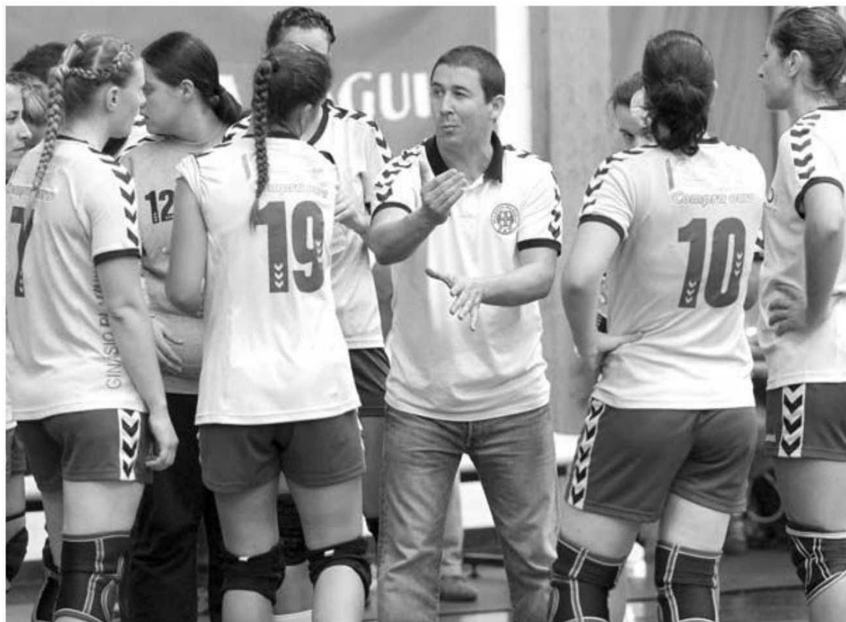
Jornada positiva para as duas equipas do andebol feminino madeirense

HERBERTO DUARTE PEREIRA desporto@dnoticias.pt