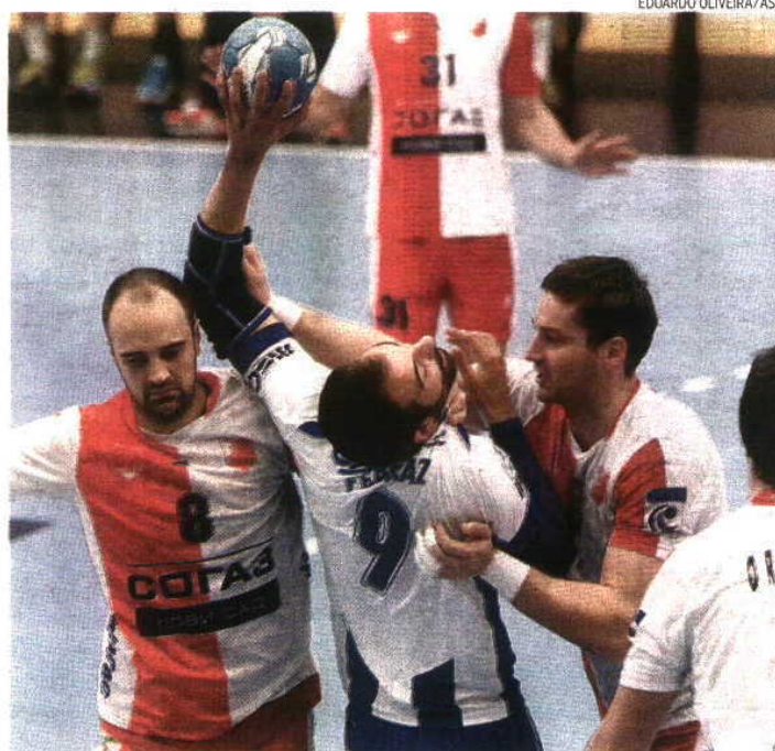
Dragões entraram mal mas reagiram a preceito, com o tiro exterior de Ferraz e não só

Libor Skruzny e Radoslav Kavulic (Rep. Checa)