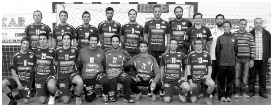
O Modicus vai agora focar-se na luta pela subida