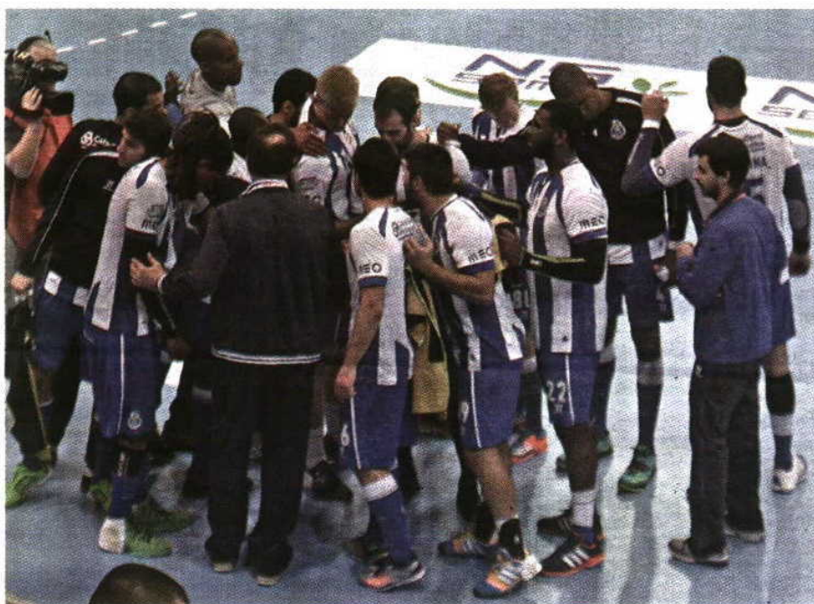
FC Porto venceu o Vojvodina, na Sérvia, por 29-27

Após a recente vitória em Novi Sad, os dragões regressaram a casa mais animados, mantendo esperanças de qualificação para os quartos de fi-