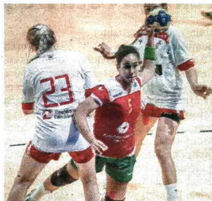
Patrícia vai emigrar com apenas 17 anos

Com 17 anos e a terminar o 12.º ano, a jogadora do Alcanena, que tem 32 golos num só jogo como recorde pessoal, irá ter aulas de alemão para poder integrar-se o mais rapidamente possível.