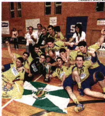
F. Holanda ganhou 'play-off' em 2009

A novidade desta época prende-se com o inédito sistema das meias-finais, à melhor de 5 jogos, que antecede a grande final. FC Porto, Sporting, ABC e Benfica conseguiram a vantagem casa nes-