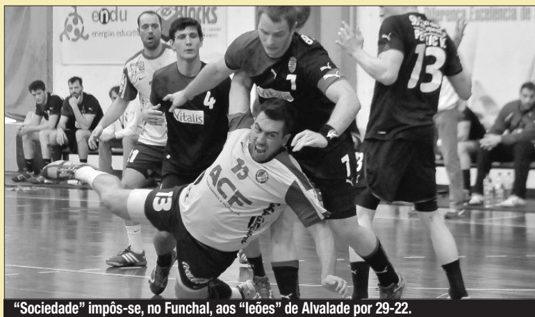
"Sociedade" impôs-se, no Funchal, aos "leões" de Alvalade por 29-22.