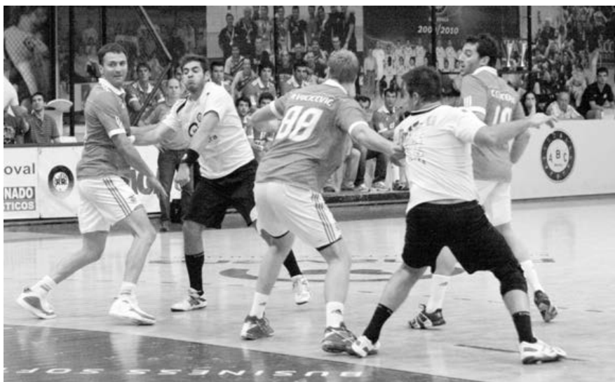
ABC de Braga voltou a perder na fase final da prova