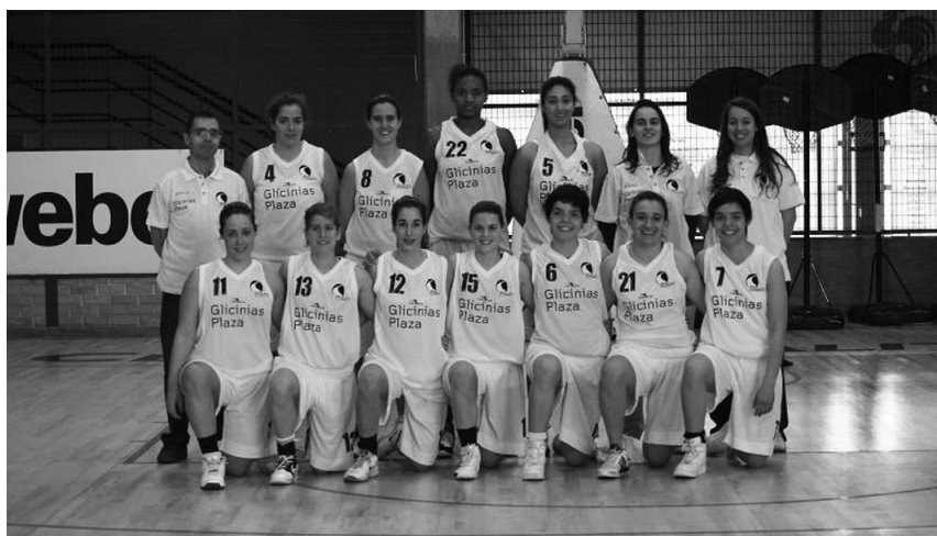
FORMAÇÃO FEMININA de basquetebol já está nas meias-finais

Mais desagradável foi o resultado do jogo da equipa de futsal masculina, no qual a AAUAv foi derrotada por 2-1. Até ao fim do dia ainda se realizaram jogos do Futebol de 11 e de Futsal. As finais de andebol, basquetebol masculino e futsal, terão lugar a partir de hoje, sendo que, nas restantes modalidades, ainda estão a decorrer os "Play-Off".