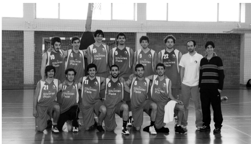
EQUIPA MASCULINA de basquetebol mantém as aspirações à reconquista do título nacional

O segundo dia da participação AAUAv nos Campeonatos Universitários ficou marcado pelo triunfo dos campeões nacionais