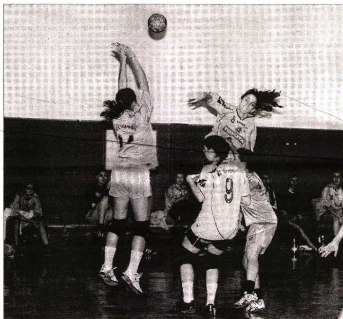
Colegiais com boa capacidade concretizadora

vas, forçando a inúmeros erros do ataque do Santa Isabel, que apenas conseguiu marcar cinco golos nos primeiros vinte minutos. Como consequência, a equipa anfitriã ia aproveitando o contra-ataque para ampliar a vantagem no marcador, que já