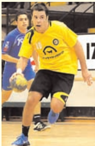
ABC vai jogar em casa