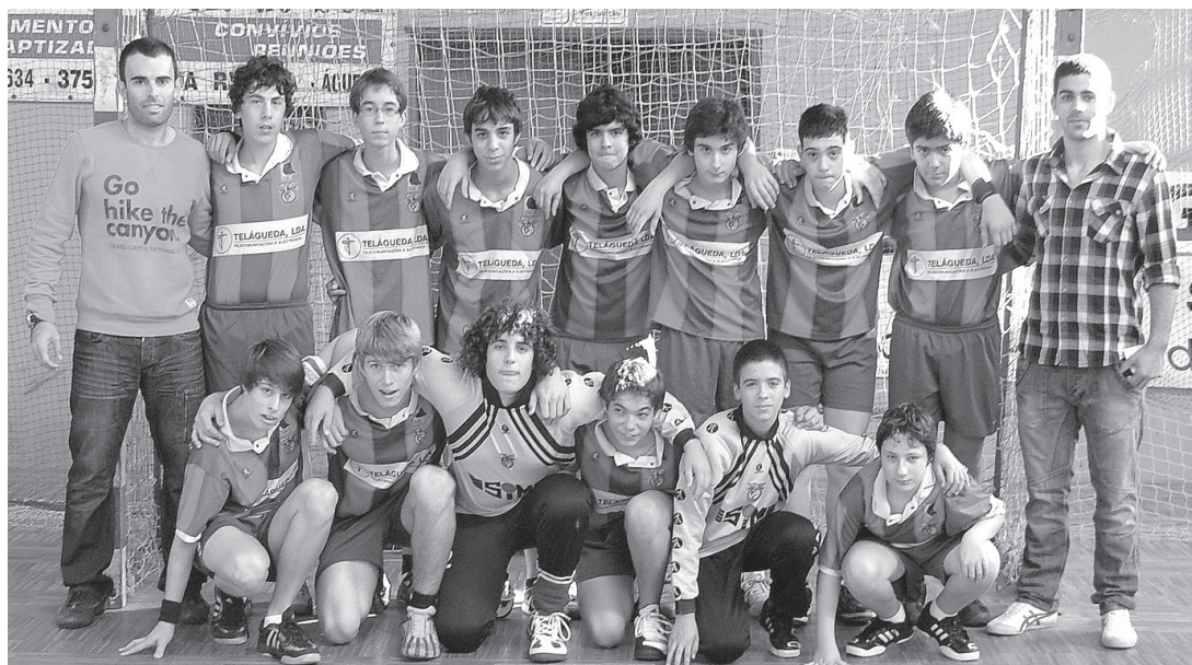
O IDL/ADT apuraram-se para a segunda fase do campeonato nacional da II divisão de iniciados