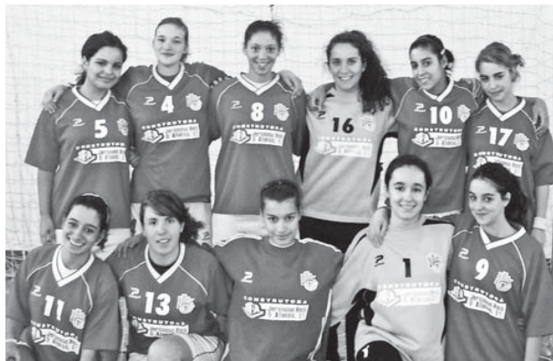
Juvenis recebem no sábado às campeãs nacionais

A Casa do Benfica em Castelo Branco conta também com um escalão de minis.