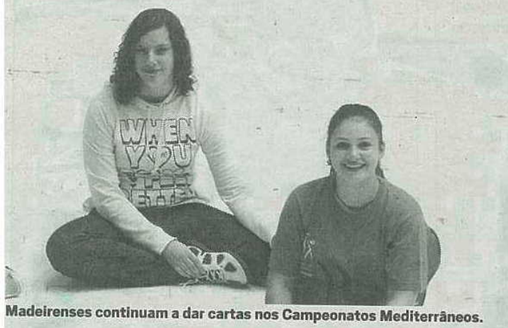
Madeirenses continuam a dar cartas nos Campeonatos Mediterrâneos.

Com o empate no segundo parcial, Portugal consegue 4,5 pontos e a Turquia, meio ponto e o que leva a equipa lusa a estar no topo do Grupo 1 antes do jogo de hoje diante da equipa da casa. P. V. L.