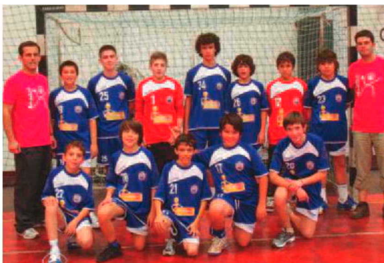
Equipa madeirense participa entre hoje e domingo no Nacional masculino.