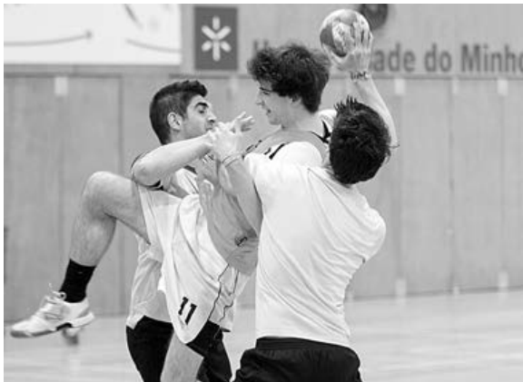
Andebol estreou-se no Troféu Reitor 2012 com vários jogos de qualidade

O primeiro encontro opôs as equipas de Eng. a Civil e Enfermagem, num jogo bem disputado, com duas equipas equilibradas e com aspirações ao título. Apesar da forte oposição dos fu-