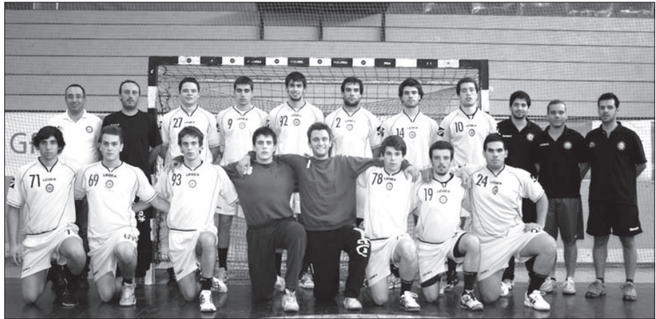
Equipa de juniores do ABC de Braga

A fase final inicia-se hoje, com o Benfica-Sporting (19h00) e ABC-FC Porto (21h00).