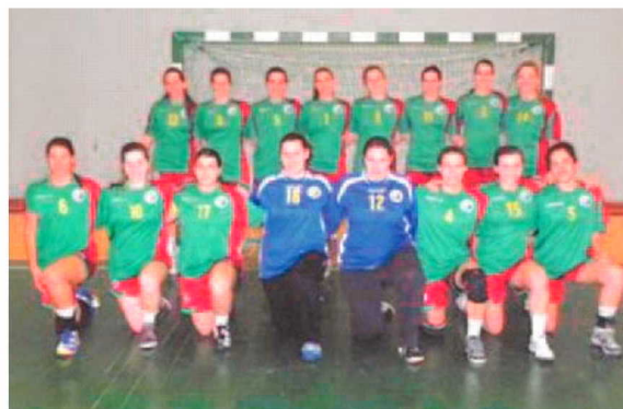
Comitiva madeirense motivada para a qualificação europeia.

De referir que Portugal estreia-se amanhã pelas 18 horas frente à equipa búlgara. P. V. L.