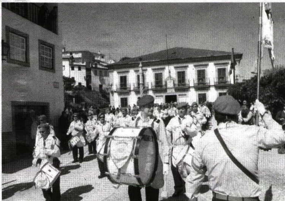
As comemorações do 25 de Abril começam pela manhã em Santa Comba Dão

Trata-se de um documentário multimédia de formas animadas constituído por teatro de marionetas, música,