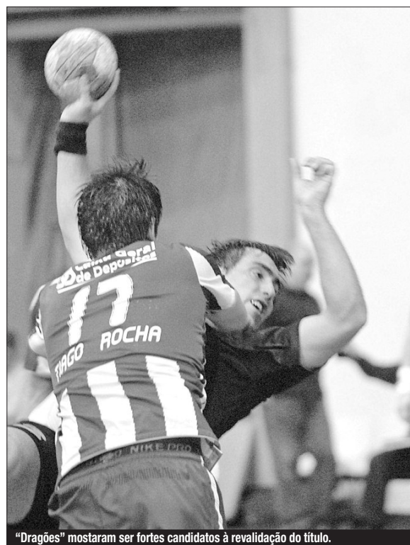
"Dragões" mostraram ser fortes candidatos à revalidação do título.