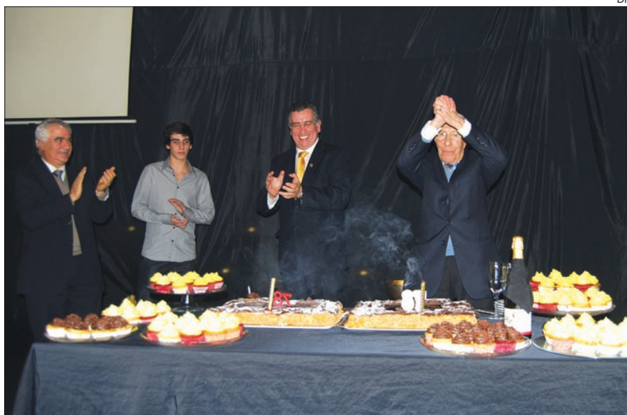
Gala do ABC vai premiar os melhores