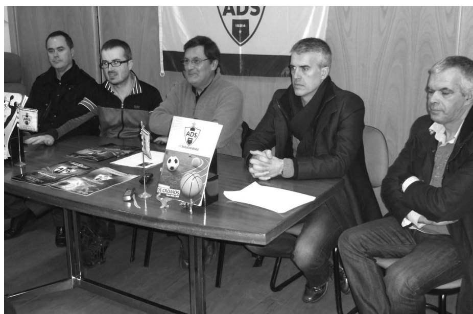
APESAR DA CRISE, responsáveis mostraram-se confiantes na venda dos cromos da Sanjoanense