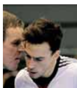
O ponta-direita Patrick Groetzki marcou seis golos no triunfo da Alemanha sobre a campeã mundial França

Patrick Groetzki, uma das figuras e o melhor marcador da selecção alemã que em 2009 venceu o Mundial de sub-21, foi o principal concretizador da sua selecção. O ponta-direita do Rhein-Neckar Löwen, actual líder da Bundesliga, marcou seis golos, incluindo o último do encontro, depois de a França perder a