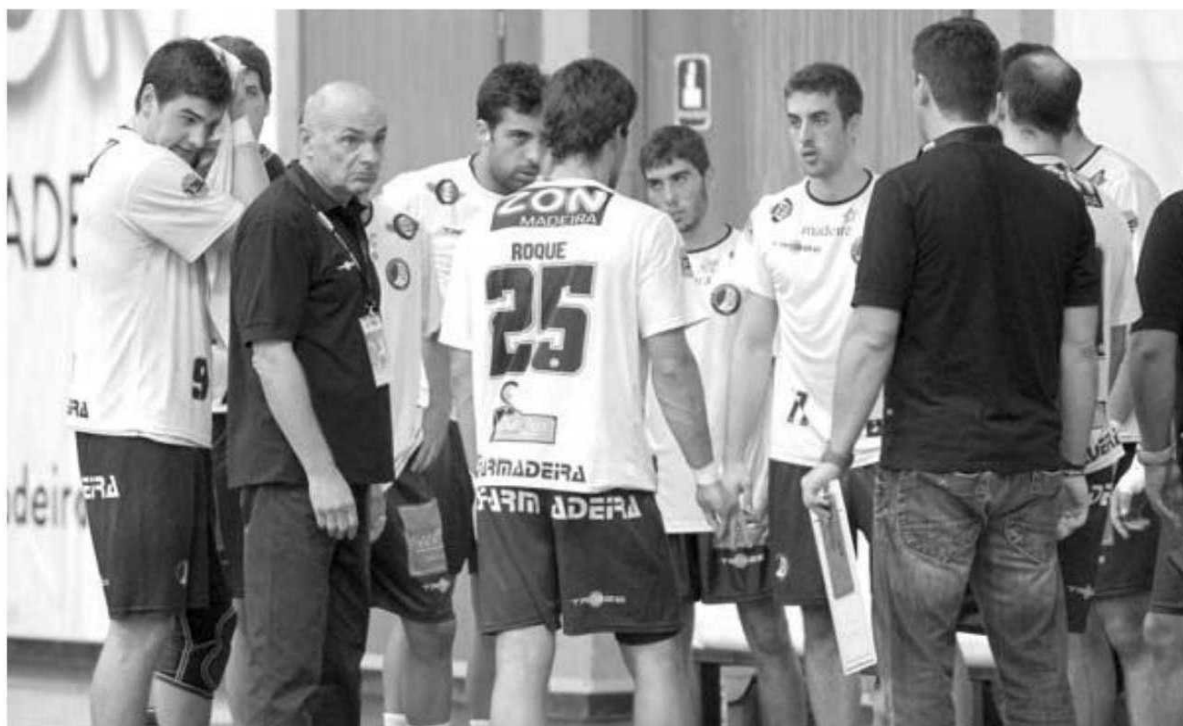
SAD desloca-se amanhã ao pavilhão da Luz.