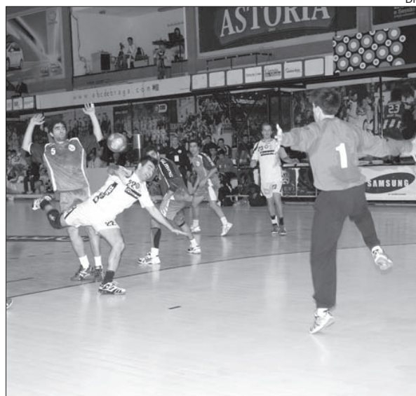
ABC recebe Sp. Horta, Xico Andebol joga com CDE Camões

Eis os jogos apazados para hoje: Belenenses-Art. Avanca (15h00), ABC/UMinho-Sp. Horta (17h00, An-