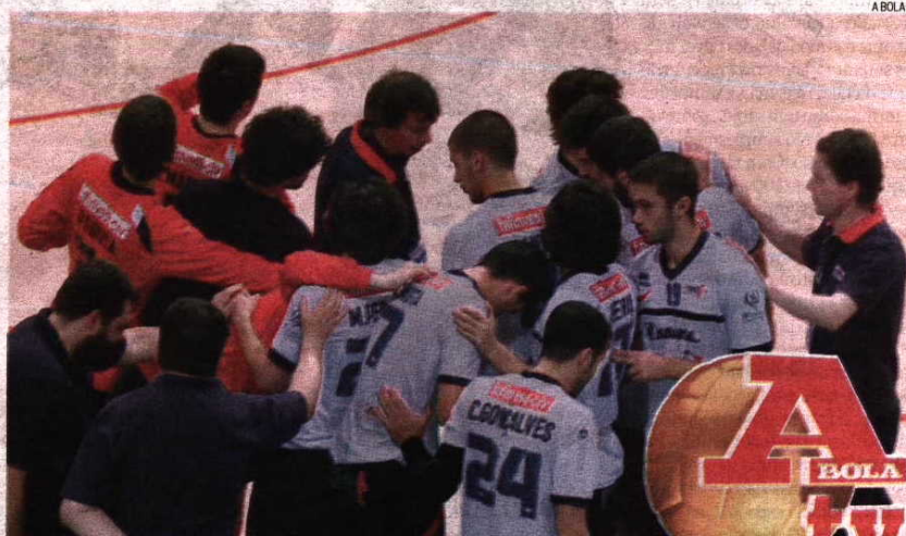
Fafe espera que a transmissão não condicione o desempenho dos jogadores mais novos