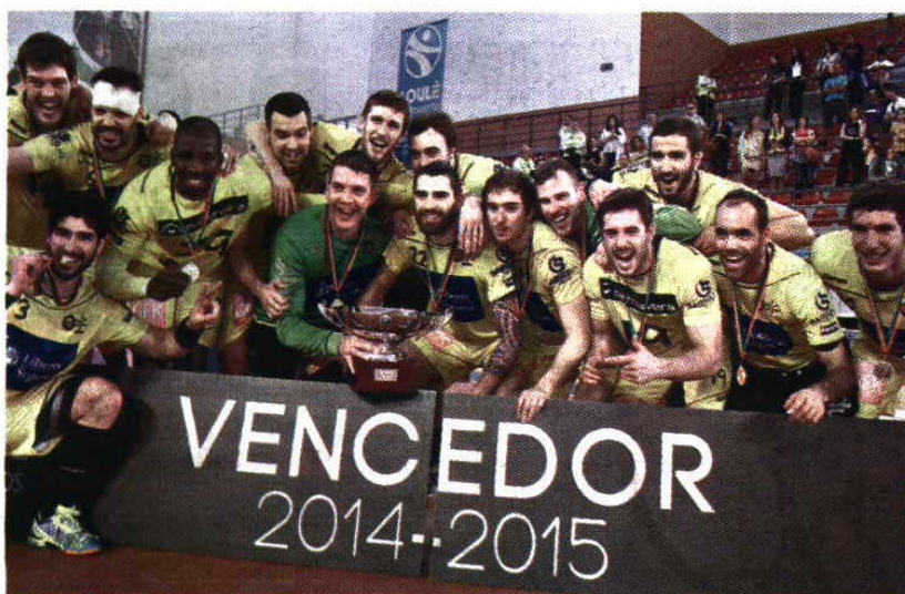
A formação minhoto já arrecadou, esta época, a Taça de Portugal, numa final com o F. C. Porto

Andebol Bracarense defrontam amanhã os romenos do Odorheiu, na primeira mão da final da Taça Challenge. Querem vingar o troféu que já deixaram fugir por duas vezes