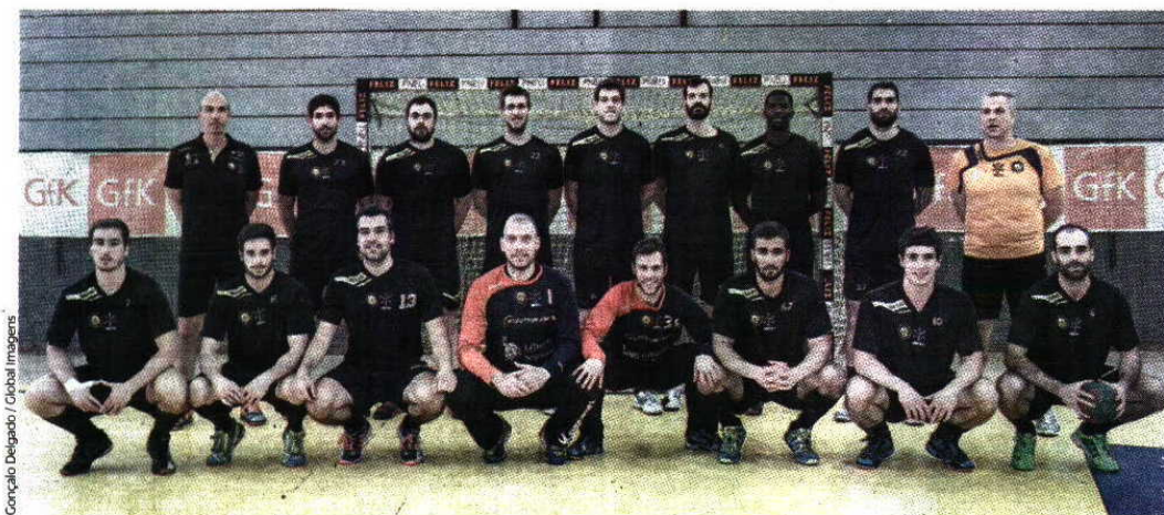
ABC, que afastou checos, finlandeses e noruegueses, está a postos para o Odorhei

TACA CHALLENGE Primeira mão da final joga-se amanhã em casa do ABC. Este procura uma vitória que torne promissora a deslocação à Roménia