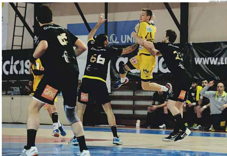
Foi frente ao Dukla Praga que o ABC iniciou a sua caminhada na Taça Challenge

Pode não ter resultado em nenhum título, mas o pedigree europeu do ABC é indelével. Além dessa campanha, soma mais quatro