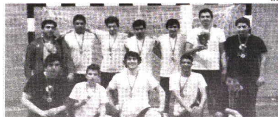
Equipa de andebol da AEDFR que competiu no Desporto Escolar