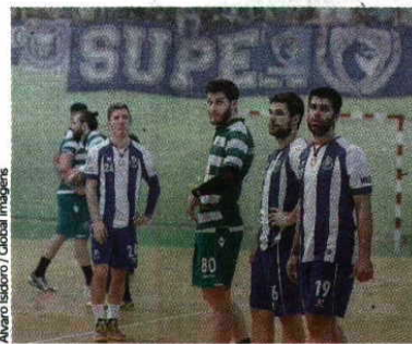
Alvaro Isidoro / Global Images

"A nível defensivo fomos muito fortes e saímos sempre bem ao portador da bola"