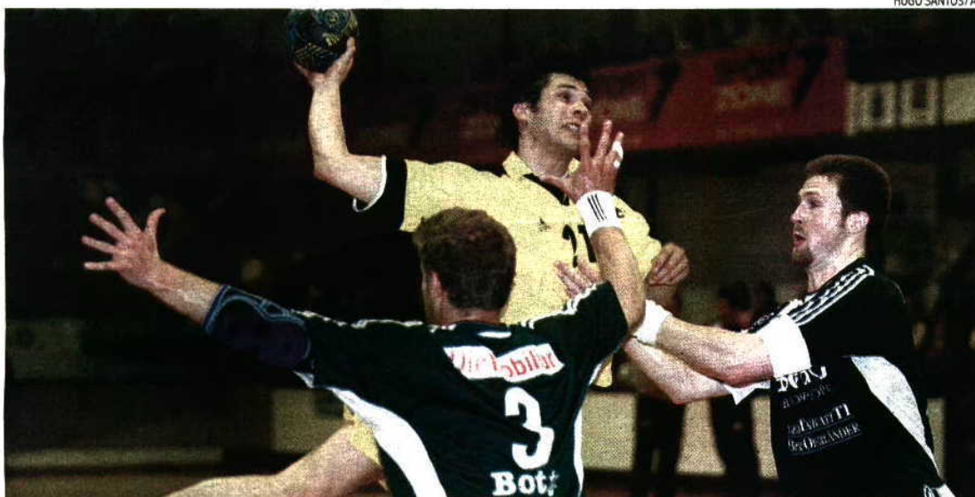
ABC busca o sucesso que lhe escapou há 10 anos, então na sua segunda final europeia, nesta mesma Taça Challenge, ante o Wacker Thun