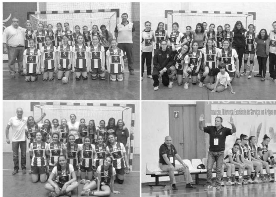
Infantis, iniciados e juvenis sagraram-se campeões da Madeira e juntamente com as juniores vão jogar os Nacionais.