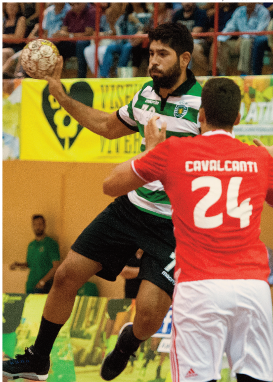
Sporting foi mais forte que o Benfica e venceu por 25-22