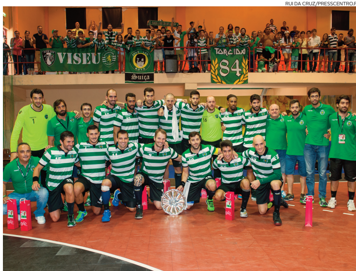
Sporting conquistou o torneio pela segunda vez consecutiva ao bater o Benfica (25-22) na final

A Associação de Andebol de Viseu (AAV) voltou a encarregar-se de organizar um dos principais e mais prestigiantes torneios da Península Ibérica – com a Federação de Andebol de Portugal e o apoio institu-