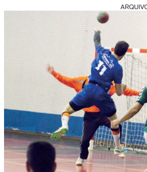
AC Sismaria perdeu o primeiro jogo e empatou outro