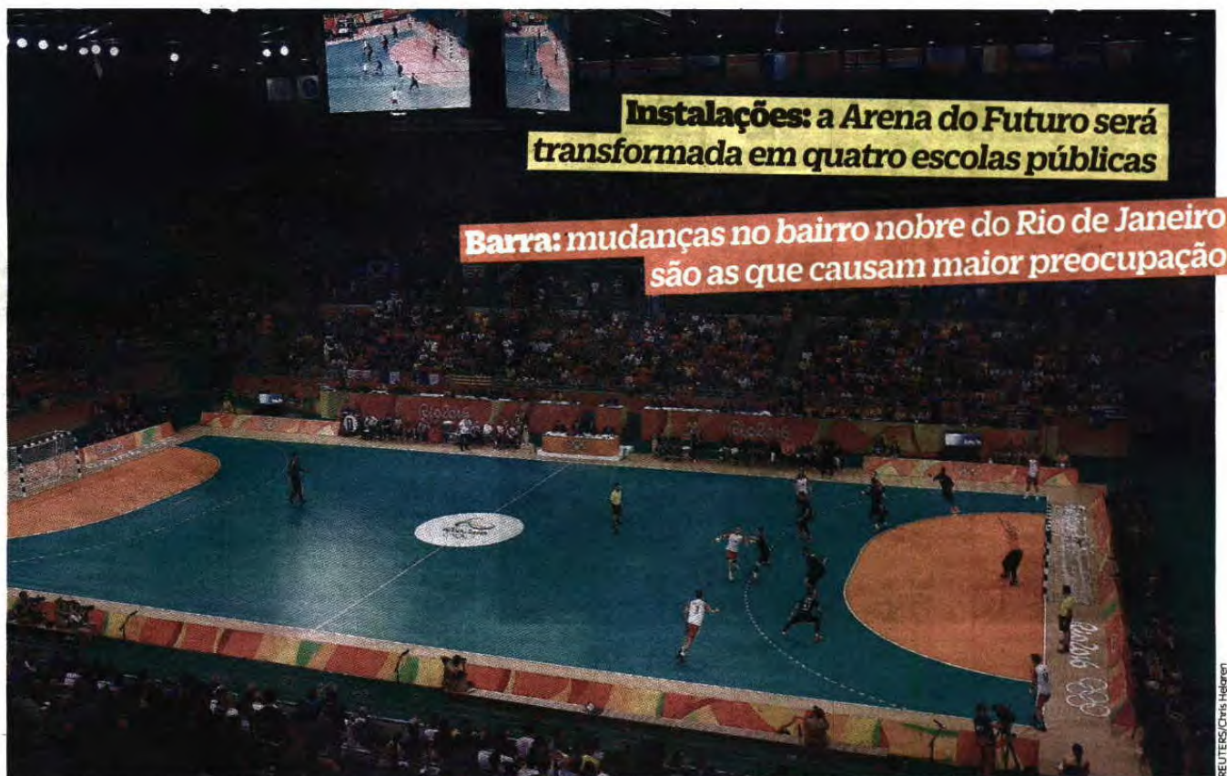
A Arena do Futuro recebeu o torneio olímpico de andebol

FUTURO Rede de transportes melhorou, haverá diversas instalações abertas à população, uma sede para o sonhado Masters de ténis e muito mais, mas a cidade está falida