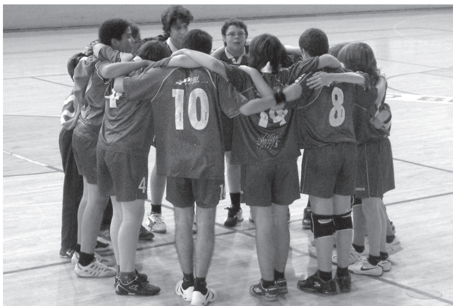
Juvenis da ADA estão unidos na procura do sucesso

Nos escalões mais novos, o último fim-de-semana ficou marcado pela realização de quatro jogos no Pavilhão Municipal de Castelo Branco, envolvendo as