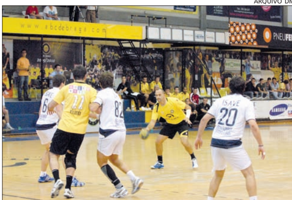
ABC e MB/Colégio Sete Fontes jogam esta tarde

Em Braga, no Pavilhão Flávio Sá Leite, considerado por muitos a catedral do andebol, voltam a estar frente a frente ABC de Braga e MB/Colégio 7 Fontes. Na primeira volta, no mesmo recinto, então na qualidade de visitados, os primodivisionários venderam cara a derrota aos academistas. Agora, e avisados das dificuldades, os comandados de Jorge Rito tudo vão fazer para vencer e