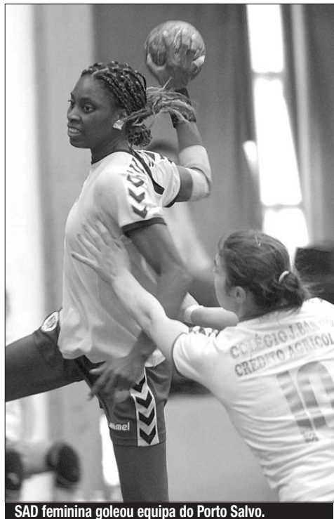
SAD feminina goleou equipa do Porto Salvo.