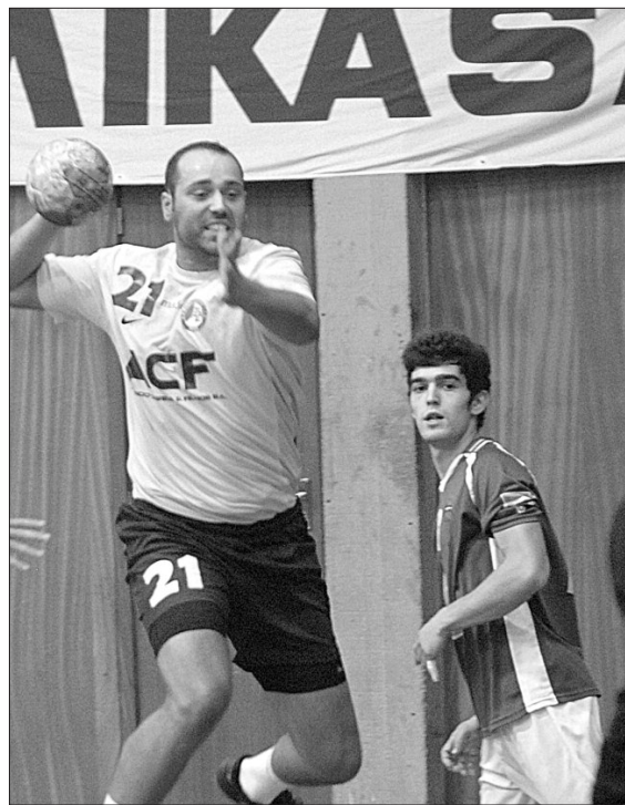
Madeira SAD foi feliz e venceu no final o Sporting da Horta pela diferença mínima.