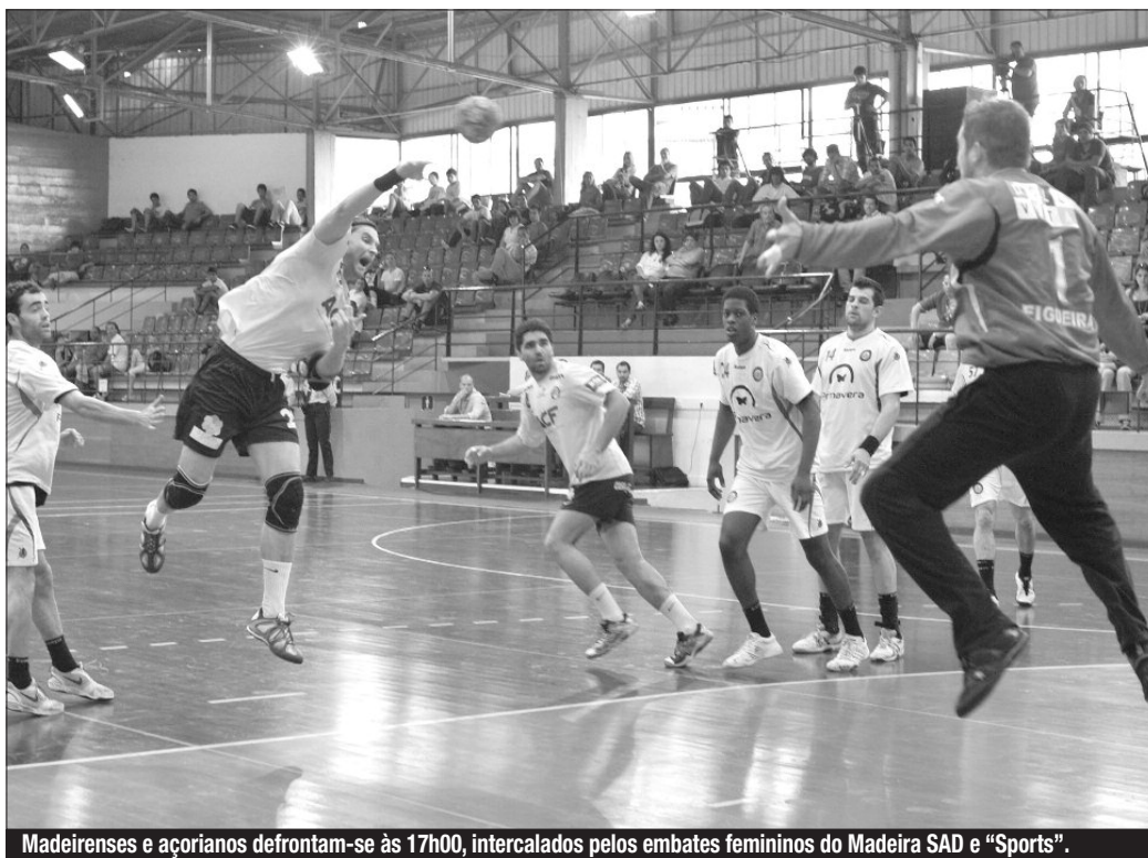
Madeirenses e açorianos defrontam-se às 17h00, intercalados pelos embates femininos do Madeira SAD e "Sports".