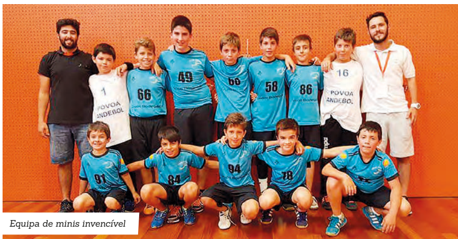
Equipa de minis invencível

Para o clube poveiro, esta foi uma "época de sonho, que dá sinais de um futuro risonho para o clube, sendo apenas mais um argumento para continuar a trabalhar arduamente no desenvolvimento do clube e na formação dos atletas".