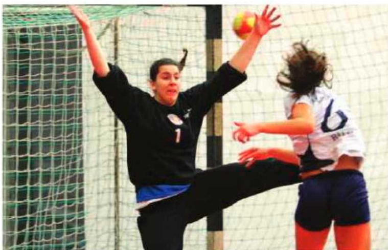
A madeirense foi distinguida ontem na IV Gala do andebol português.