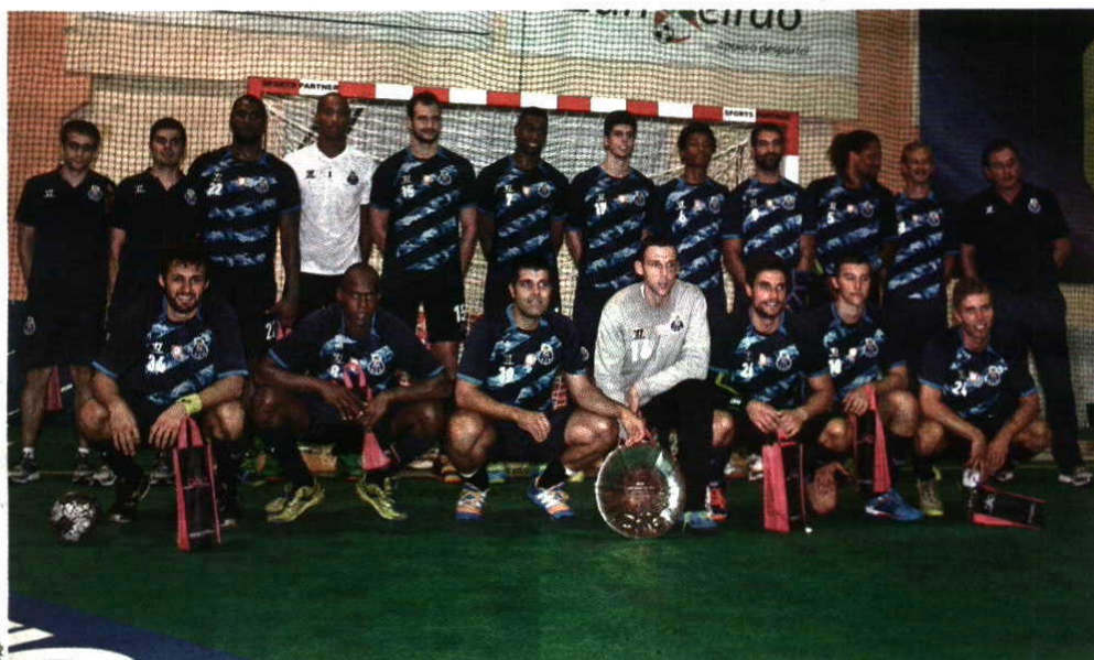
FC Porto conquistou mais um troféu, provando estar em forma para o duro teste do próximo fim de semana