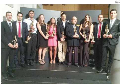
Galardados da noite do Andebol em Viseu

O evento, que contou com diversas personalidades do