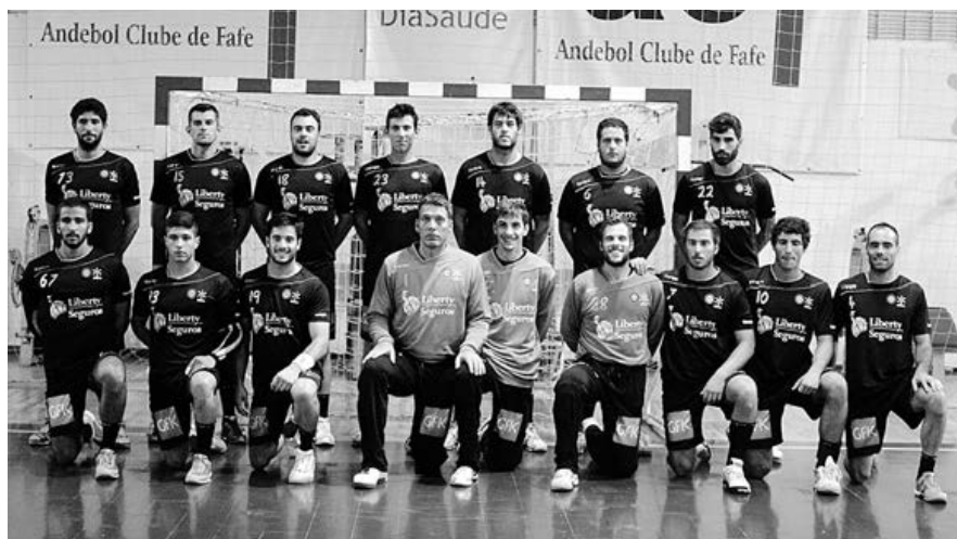
Equipa do ABC/UMinho conquistou, ontem, o troféu de campeão do Torneio Cidade de Fafe, organizado pelo Andebol Clube de Fafe

"Assistiram-se a bons jogos e o ABC foi um justo vencedor. Mas todas as equipas cumpriram os seus objectivos, que nesta fase