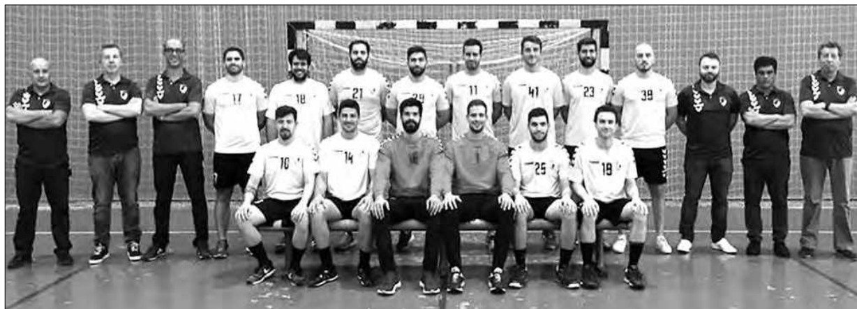
Plantel do Fermentões para a época 2018/19

O CCF Fermentões arrancou, ontem, para uma nova temporada, onde vai disputar o principal campeonato nacional de andebol, escalão em que já não participava há muitos anos.