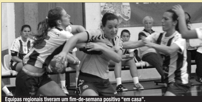
Equipas regionais tiveram um fim-de-semana positivo "em casa".