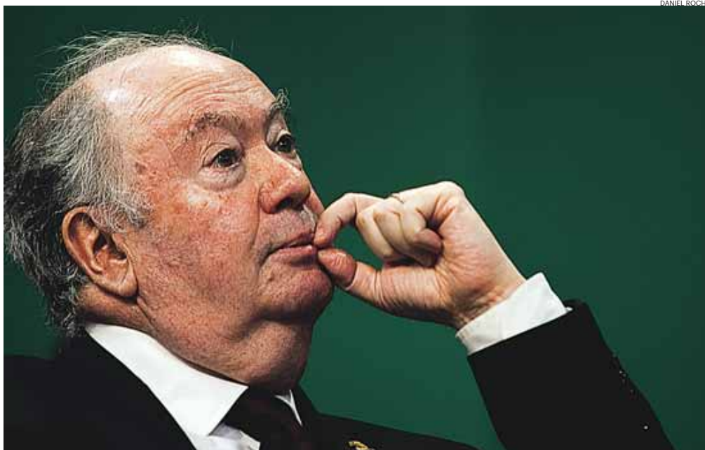
Sector empresarial público continua a ser uma dor de cabeça para Alberto João Jardim