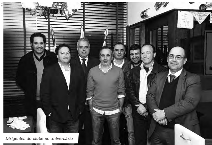
Dirigentes do clube no aniversário

No último fim-de-semana, o Póvoa Andebol voltou a justificar a sua qualidade ao vencer todos os jogos disputados nas várias categorias. Em Juvenis bateu, em casa, o Gaia por 28-27. No escalão de Iniciados venceu na casa do Padroense por 11-23. Em Infantis venceu fora o Gondomar por 8-25. No escalão de Minis, a vitória também sorriu quer à equipa masculina quer à feminina, ao bater por 20-17 e 31-7, o Académico e o Infesta, respetivamente.