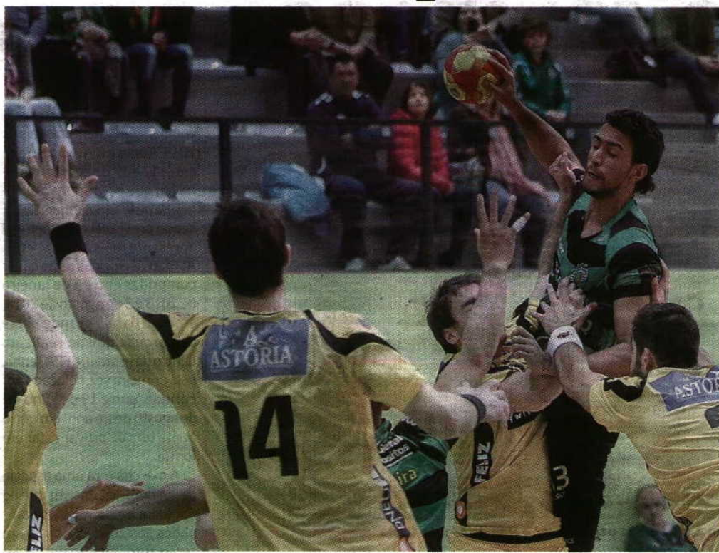
Clássico - ABC joga hoje com o Sporting em Lisboa