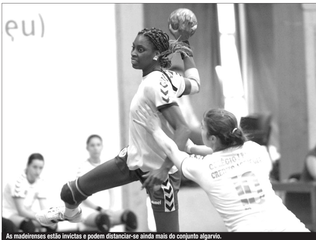
As madeirenses estão invictas e podem distanciar-se ainda mais do conjunto algarvio.