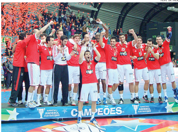
Encarnados festejam a vitória no Portimão Arena

APÓS UMA FINAL muito disputada que o resultado final não espelha, o Benfica conquistou no passado sábado a Supertaça de Andebol Portimão 2011, ao vencer o Águas Santas por 28-20 na decisiva partida, que galvanizou o muito público que ocorreu ao Portimão Arena.