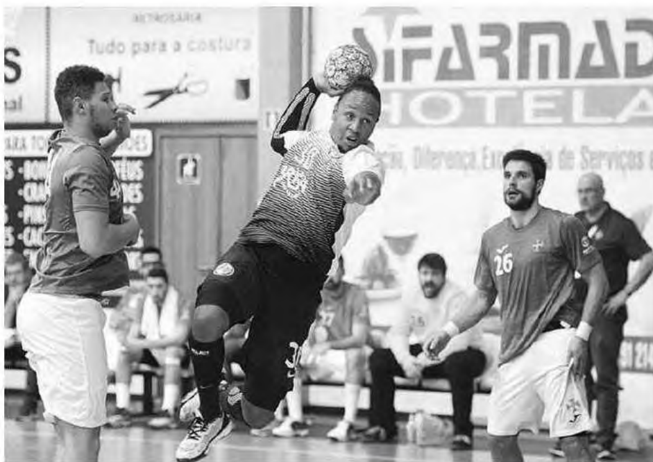
Madeirenses recebem esta noite, pelas 19 horas, a visita do Avanca.

Um quadro que vai merecer por parte de toda a estrutura do Madeira Andebol SAD uma redobrada atenção e determinação, num encontro que se prevê de extrema dificuldade para a equipa da casa, não só pelo valor do seu opositor, mas sobretudo porque também nesta altura da temporada, em particular este mês de Fevereiro, o grupo de trabalho está confrontado com uma carga competitiva de grande responsabilidade.